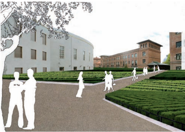
Propuesta de intervención en la Colina de los Chopos. Autores: Junquera y asociados.

En el marco de los planteamientos elaborados por el Proyecto Estratégico, se apunta a la recuperación y revitalización de espacios urbanos capaces de atraer el talento y la investigación. En este sentido, se contrata la elaboración de un Plan Director en el ámbito de la Colina de los Chopos al equipo Junquera Arquitectos S.L., con la intención de elaborar un modelo de articulación funcional, arquitectónica y paisajística de los diferentes centros de enseñanza e investigación existentes en este ámbito, proponiendo igualmente un modelo de funcionamiento y servicios posterior.