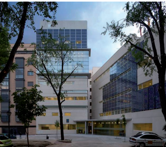
Placas fotovoltaicas para la generación de energía distribuida. Huerta Solar Urbana.