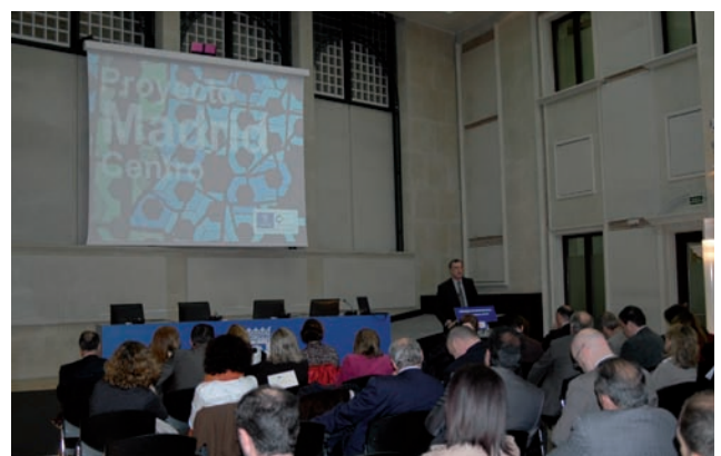
Presentación del Proyecto Madrid Centro.