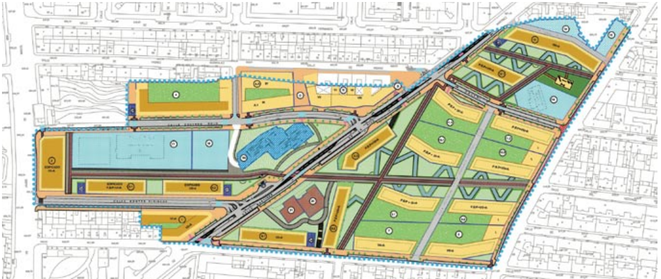
PE de Mejora Ambiental: Colonias de San Francisco Javier y Nuestra Señora de los Ángeles. Ámbito de actuación.