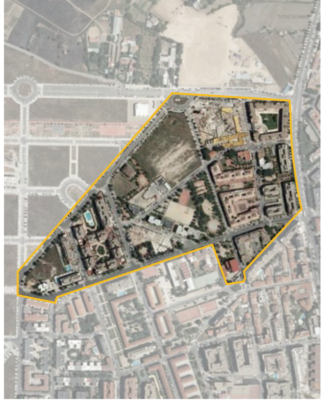
Terrenos correspondientes al ámbito de compensación API.21.07 Arroyo del Tesoro. Distrito de Barajas.