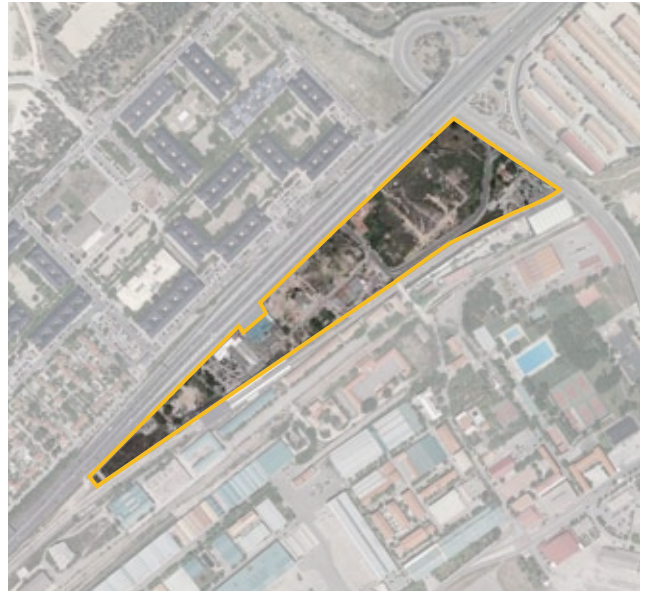
Terrenos correspondientes al ámbito de compensación APR.10.01 La Medina. Distrito de Latina.