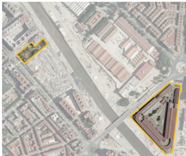
Terrenos correspondientes al ámbito de expropiación APE.02.26 Antiguo Mercado de Frutas y Verduras. Distrito de Arganzuela.