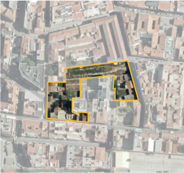
Terrenos correspondientes al ámbito de compensación APR.06.04 Almansa-Tenerife. Distrito de Tetuán.