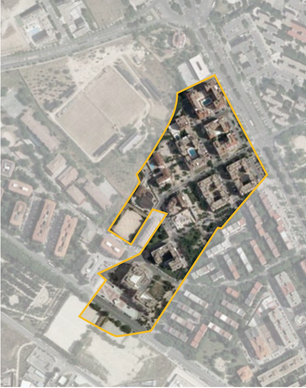
Terrenos correspondientes al ámbito de compensación API.15.11 Borde Sur García Noblejas. Distrito de Ciudad Lineal.