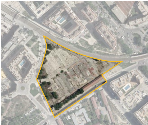
Terrenos correspondientes al ámbito de compensación APE.02.104 Avda. del Planetario c/v a c/ Meneses. Distrito de Arganzuela.

Las fechas resaltadas corresponden al periodo analizado