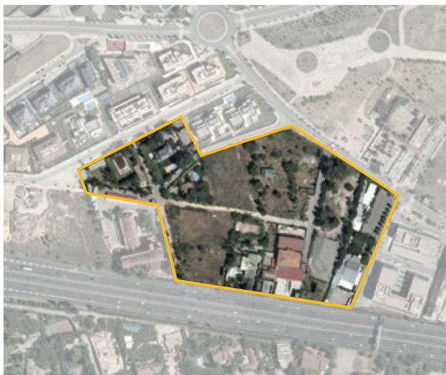
Terrenos correspondientes al ámbito de compensación APE.09.22 Valdemarín-Nudo del Barrial. Distrito de Moncloa-Aravaca.