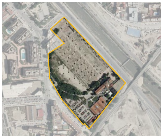
Terrenos correspondientes al ámbito de convenio APR.12.06/M Subestación Puente de la Princesa. Distrito de Usera.