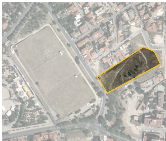
Expropiación en c/ Ricardo San Juan. Distrito de Hortaleza.