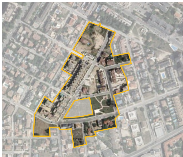
Terrenos correspondientes al ámbito de cooperación API.08.13 C/ Sandalia Navas. Distrito de Fuencarral-El Pardo.