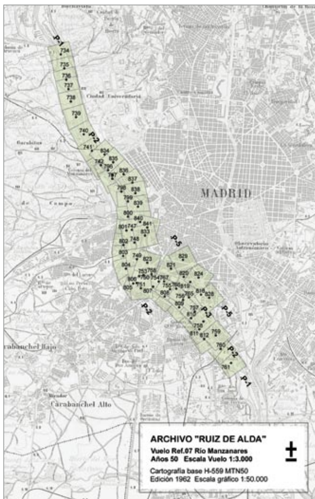
Gráfico de vuelo. Años 50.

El archivo fotográfico continúa con los trabajos de digitalización de fondos que se materializan en 2009 en el proyecto de digitalización y georeferenciación de los gráficos de vuelo históricos "Ruiz de Alda".