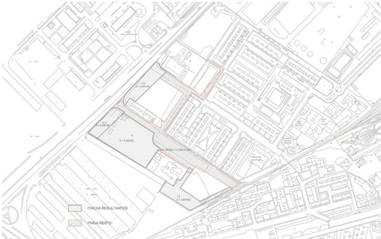
Parcelas resultantes obtenidas en el ámbito API 10.07 "Colonia Parque Europa".