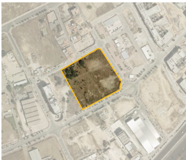
Autorización de ocupación de la parcela ZD del APE 08.14 "Industrial Carretera de Burgos" para la construcción de un centro deportivo.