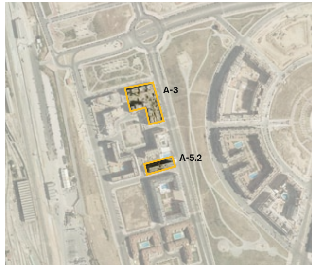
Parcelas A-3 y A-5.2 del UZI 0.08 "Las Tablas", cedidas a la EMVS para la construcción de viviendas en régimen de protección pública.