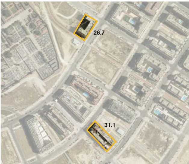
Parcelas 26.7 y 31.1 del UZI 0.07 "Montecarmelo", cedidas a la EMVS para la construcción de viviendas en régimen de protección pública.