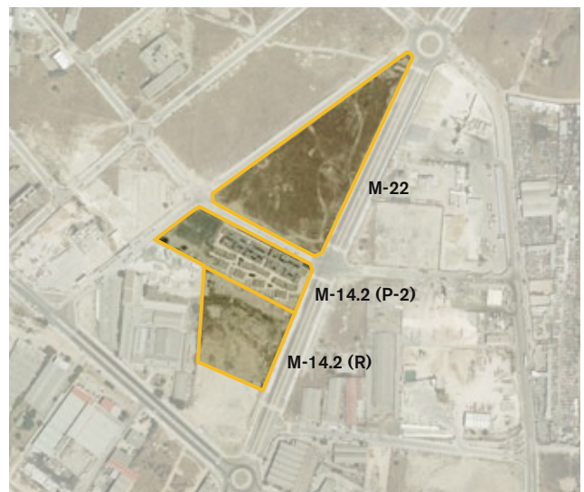
Autorización de ocupación de las parcelas M-22, M-14.2 (P-2) y M-14.2 (R) del API 19.04 "Polígono Industrial de Vicalvaro" para la construcción de un depósito de vehículos, un centro de acogida para personas sin hogar y una base del Samur y parque de bomberos, respectivamente.