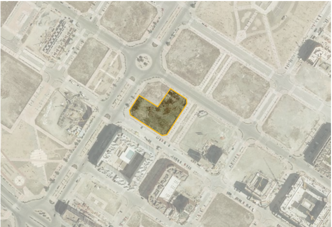
Derecho de Superficie de la parcela 2.48 UZP 1.03 "Ensanche de Vallecas" cedida a la Comunidad de Madrid para la construcción de un centro sanitario.