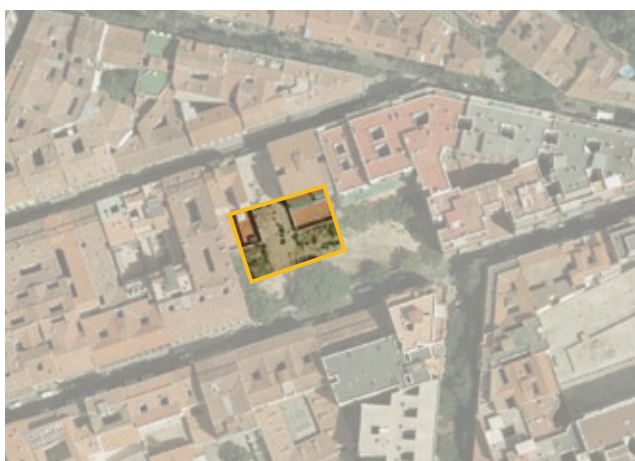
Autorización de ocupación de una parcela en la Calle Doctor Fourquet 24, para un proyecto de autogestión vecinal.