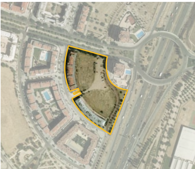
Autorización de ocupación de la parcela municipal E-10 del API 14.06 "Ensanche Este de Pavones" para la construcción de un polideportivo municipal.

*La autorización de ocupación es de carácter oneroso.