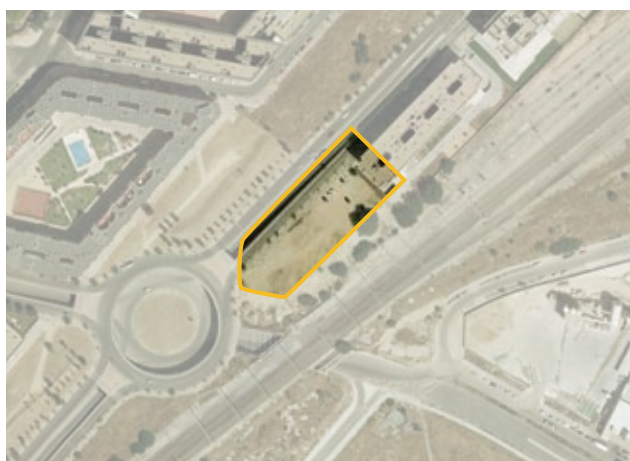
Parcela 15.1 del APE 19.10 "Valderribas, Avda. Gran Vía Este", enajenada mediante concurso.