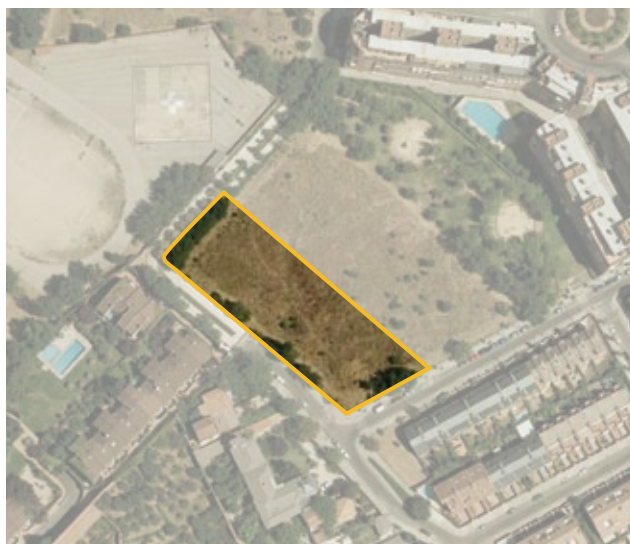
Autorización de ocupación de la parcela EQ-6 del API 20.07 "Quinta de los Molinos" para la construcción de un centro de mayores.