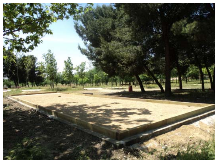
PISTAS DE CHITO Y DE PETANCA