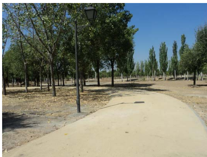
ANTES Y DESPUÉS DEMOLICIÓN DE EDIFICIO