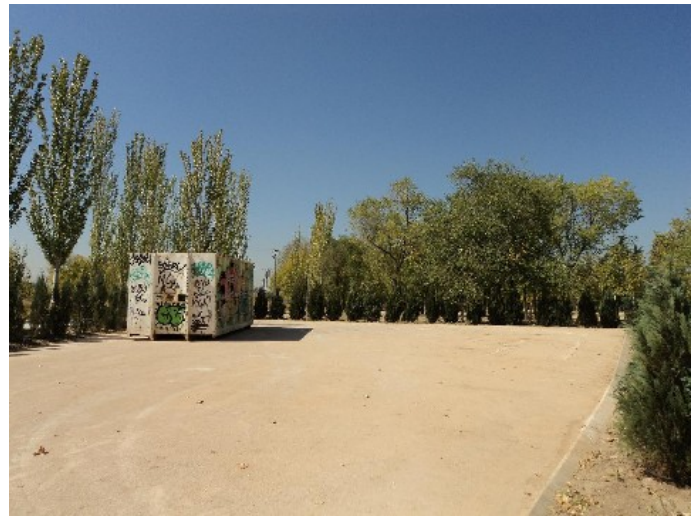
PLATAFORMA CONTENEDOR DE RESIDUOS VEGETALES