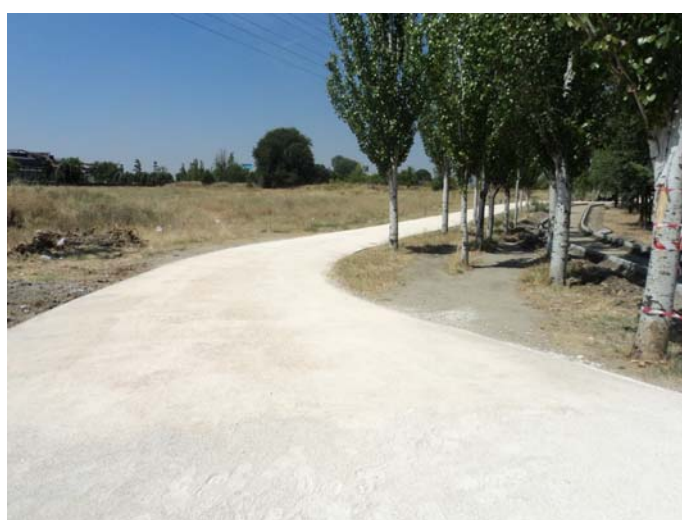
ANTES Y DESPUÉS AUDITORIO Y CAMINO DE SERVICIO