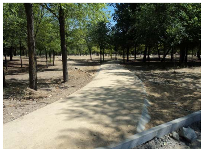
ANTES Y DESPUÉS CAMINOS DIVERSOS