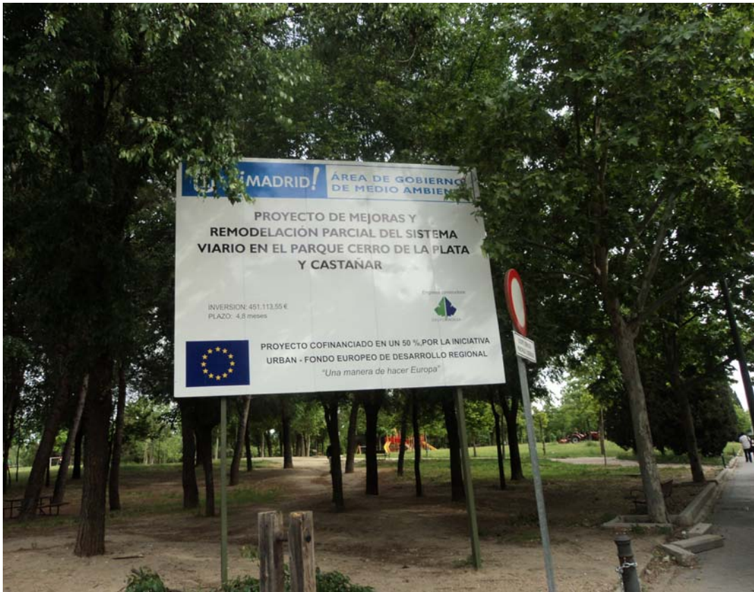
CARTEL DE OBRA