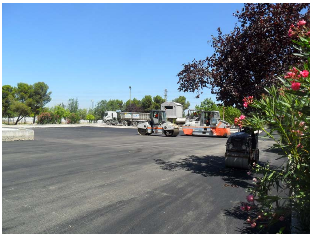
COMPACTACIÓN DE ZAHORRAS Y EXTENDIDO DE ASFALTO