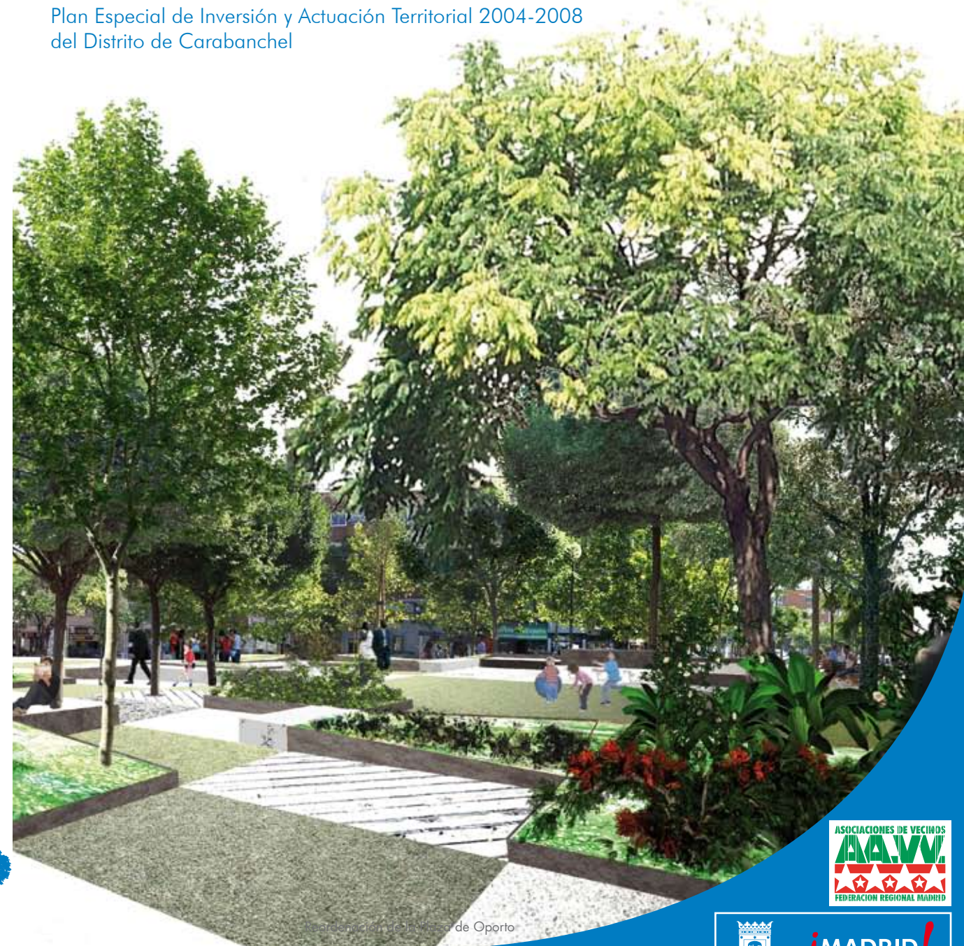
Remodelación de la Plaza de Oporto

Plan Especial de Inversión y Actuación Territorial 2004-2008 del Distrito de Carabanchel