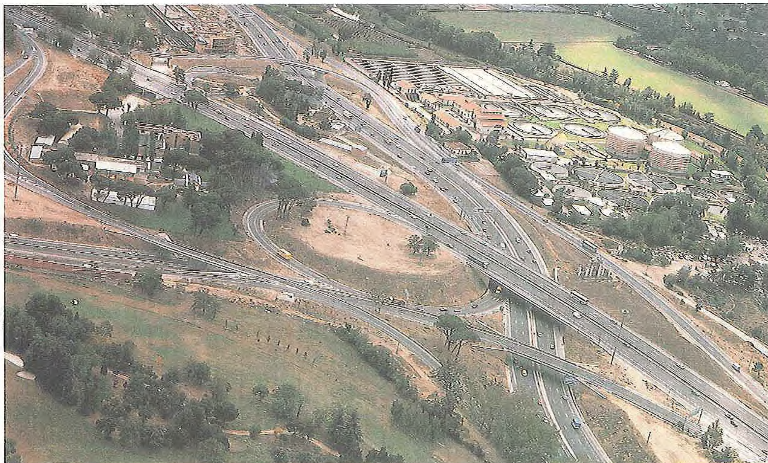
1982. Depuradora de viveros de la villa. 1991. Enlace de Puerta de Hierro

En 1984 se confecciona el Plano de Ordenación Urbana que contempla la construcción y rehabilitación de miles de pisos y da prioridad a unas zonas sobre otras a la hora de edificar, teniendo como objetivo el equilibrio urbano, estimulando la construcción de áreas comerciales, instalaciones deportivas, sanitarias, educativas y culturales. También se potenció la recuperación de edificios del Patrimonio Municipal. El equipamiento comercial se mejoró con la unidad alimentaria de Mercamadrid, dejando inhabilitados los antiguos mercados Centrales de Frutas y Pescados de la Plaza de Legazpi y Puerta de Toledo.