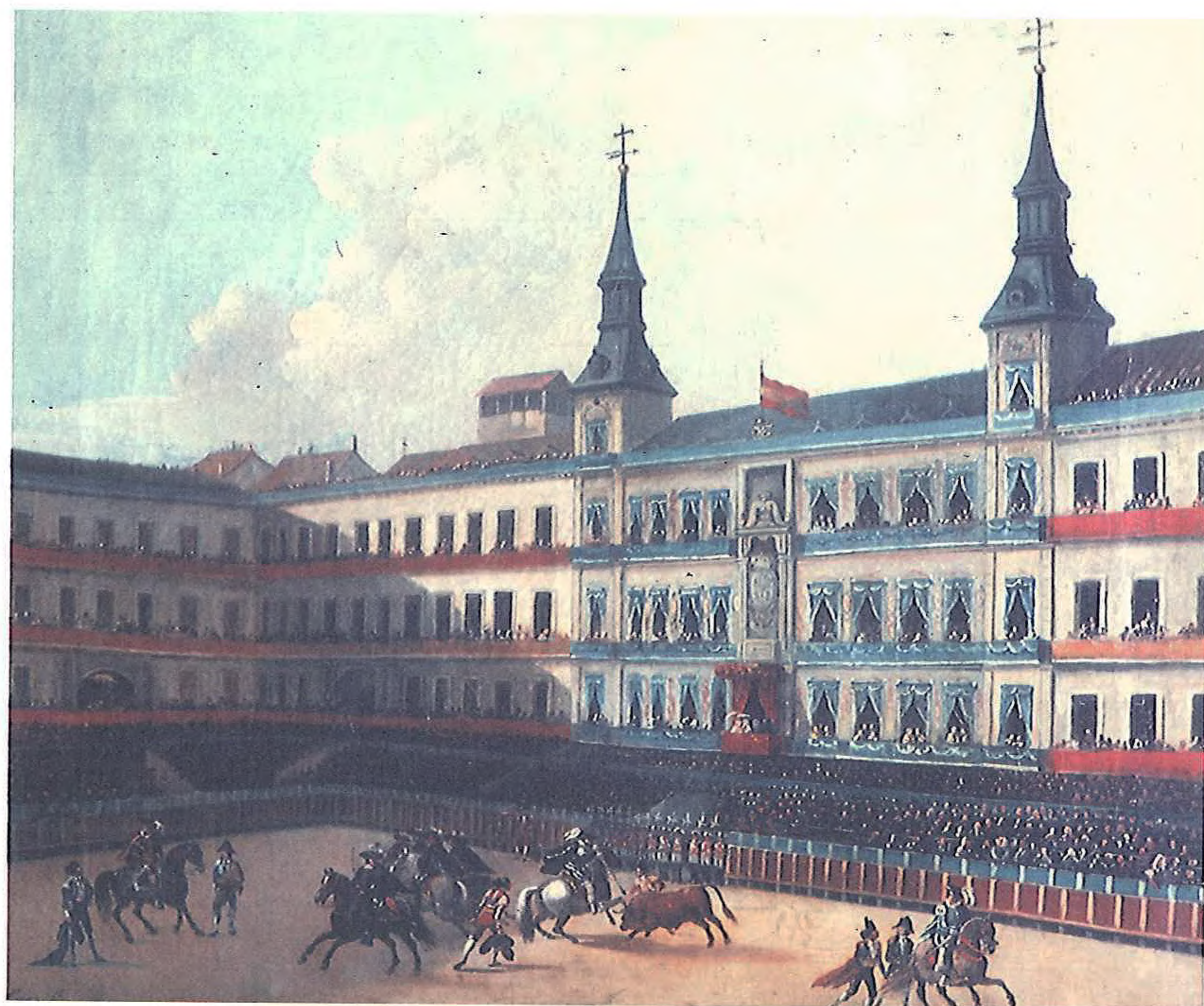
Vista de la Plaza Mayor de Madrid durante la función real de toros. 1846. José Rubio de Villegas

contaba con el apoyo de la escuadra del almirante Topete. Las fuerzas leales a la reina fueron derrotadas en Alcolea. Isabel que se hallaba en San Sebastian, huyó a Francia el día 30 de septiembre después de treinta y cinco años de reinado. Cuentan que al observar la indiferencia con que el pueblo la vió partir exclamó: "Creí tener más raíces en este país."