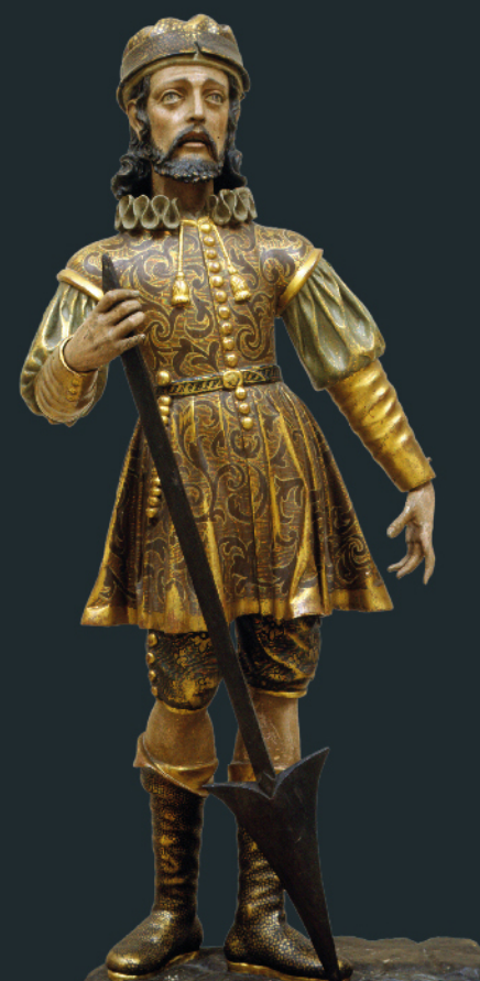
Anónimo San Isidro (Siglo XVII) Escultura MUSEO DE HISTORIA DE MADRID. IN 8476

La exposición va a permitir mostrar a los madrileños y al público en general un importante conjunto de obras que apoyan y profundizan en el conocimiento de los más variados aspectos relacionados con San Isidro, algunos de ellos muy conocidos y otros no tanto. Se incide en las representaciones iconográficas; en temas de la vida del santo y, por supuesto, de su mujer, Santa María de la Cabeza; en sus milagros más conocidos; en la abundante literatura y otras creaciones artísticas que ha inspirado su figura a lo largo del tiempo, así como también en el aspecto festivo y las múltiples tradiciones relacionadas con el patrón de Madrid.