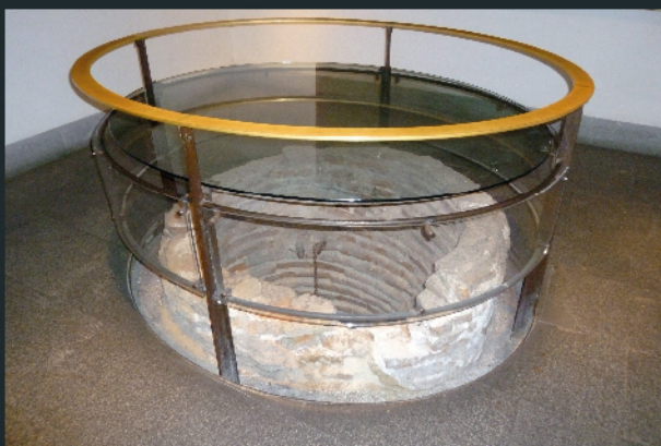
Pozo del milagro

Este Museo está estrechamente relacionado con la figura del santo labrador. Según la tradición, en el lugar que ocupa la Capilla vivió y murió el santo; también aquí se halla el pozo en el que realizó uno de sus más famosos milagros: sacar del agua a su hijo, Illán, sano y salvo. Alberga entre sus colecciones numerosas obras relacionadas con él y con su mujer, Santa María de la Cabeza. Mediante pinturas, esculturas y otro tipo de manifestaciones artísticas se representa su vida, iconografía, milagros o tradiciones.