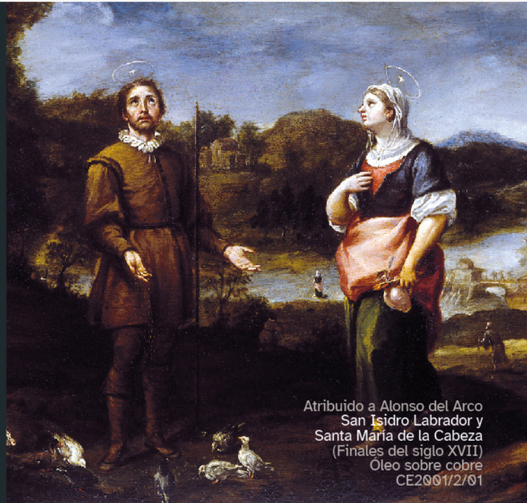
Atribuido a Alonso del Arco San Isidro Labrador y Santa María de la Cabeza (Finales del siglo XVII) Oleo sobre cobre CE2001/2/01

El Museo de San Isidro se ha querido sumar a los actos organizados con motivo del IV Centenario de la canonización de San Isidro, que tuvo lugar el 12 de marzo de 1622, con la organización de esta exposición que analiza desde los más variados puntos de vista la extraordinaria figura del santo patrón de Madrid. La muestra se inscribe dentro del intenso programa de actuaciones que ha desarrollado el Ayuntamiento de Madrid con motivo del Año Jubilar declarado por la Santa Sede (15 de mayo de 2022 - 15 de mayo de 2023).