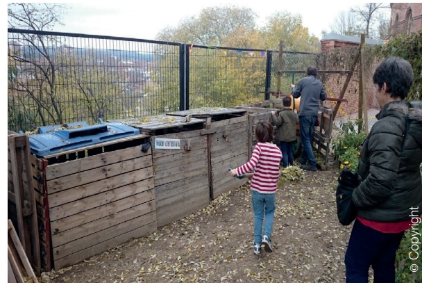
Huerto La Cornisa, Distrito Centro, Madrid

A esta línea de trabajo se suman los más de 40 huertos terapéuticos existentes en distintos centros municipales (Centros de Mayores, Bibliotecas, Centros de Salud, Centros de Ayuda a Drogodependencias, Centros Culturales y Centros de Educación Ambiental), con una demanda creciente.