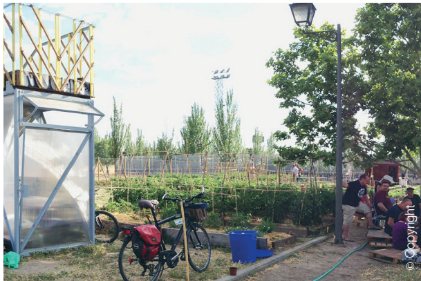
Huerto Ladis, Villaverde, Madrid