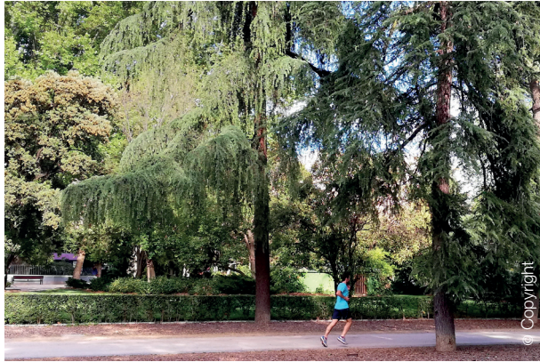
Jardines del Buen Retiro, Madrid