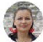
Angélica Arias Ministra de Cultura y Patrimonio