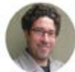
Jordi Pascual Ciudades y Gobiernos Locales Unidos