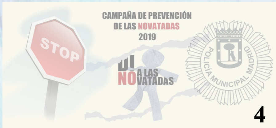
Concienciación contra las novatadas y el botellón