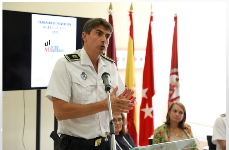
El intendente de Moncloa en un momento de su intervención