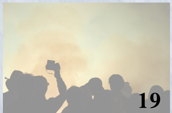
Eventos destacados en la ciudad de Madrid