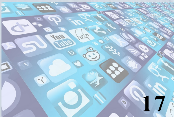
Policía Municipal en las Redes