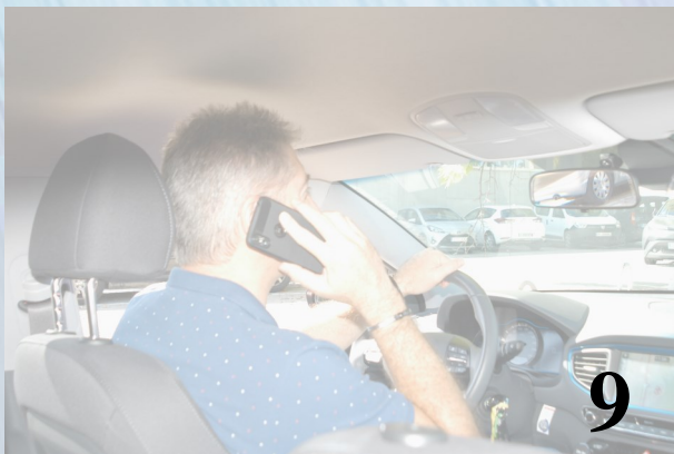
Campaña de seguridad: contra las distracciones al volante