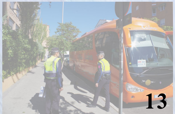
Comienzo del curso, primeros datos de las inspecciones a autobuses escolares