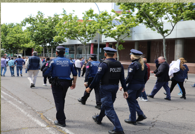
Una pareja de agentes berlineses patrullan junto a componentes de Policía Municipal.

El objetivo de estos encuentros consiste en el conocimiento de los protocolos de las diferentes policías europeas