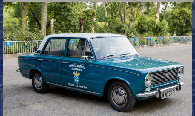
Uno de los modernos coches policiales y el clásico Seat 124, utilizado por el Cuerpo de Policía Municipal en los años 70.