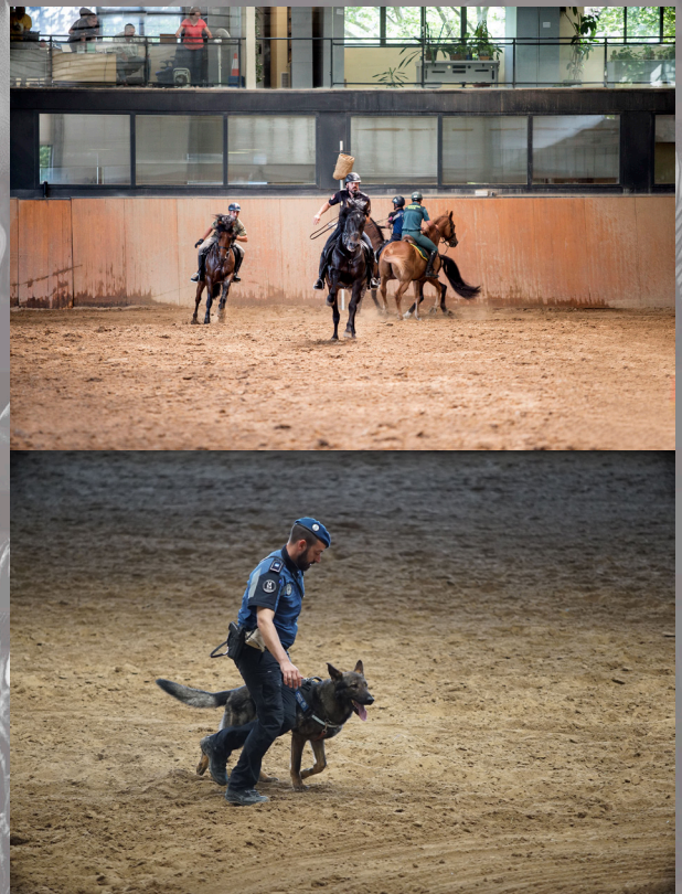
Representantes de los diferentes escuadrones en el transcurso de las pruebas, y uno de los perros de la Sección Canina junto a su adiestrador.

Otra de las exhibiciones vino de la mano de la Sección Canina de Policía Municipal, en la que los animales mostraron sus excelentes habilidades y en la que cada can estaba especializado en una materia diferente. Así, se observaron ejercicios perfectamente ejecutados en la detección de sustancias estupefacientes, dinero, explosivos o incluso personas. Debemos destacar, la excelente coordinación de movimientos de los animales al caminar y moverse junto a sus adiestradores, y la atención y obediencia inmediata para cada instrucción recibida.