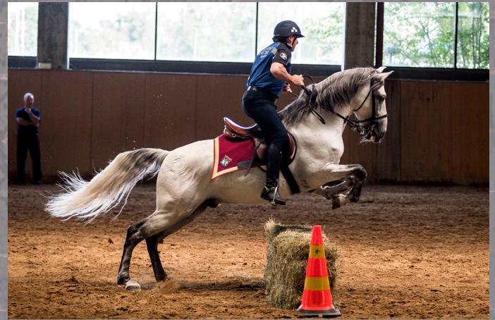
Agente del Escuadrón de Policía Municipal de Madrid durante la exhibición.