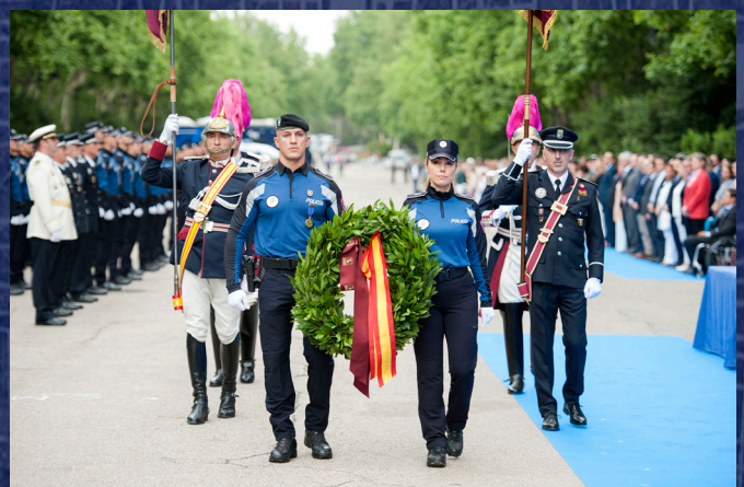
Agentes portando una corona de laurel para el acto en memoria de todos los policías fallecidos.

Tras la entrega por parte de las autoridades de las condecoraciones a agentes distinguidos por actuaciones relevantes y trayectorias profesionales destacadas (ver páginas 9 y 10), siguió el emotivo homenaje a los componentes que perdieron la vida en acto de servicio. Una comitiva flanqueada con el estandarte del Cuerpo entregó al alcalde y al comisario general una corona de flores, que depositaron al pie del monolito en memoria de los agentes fallecidos.