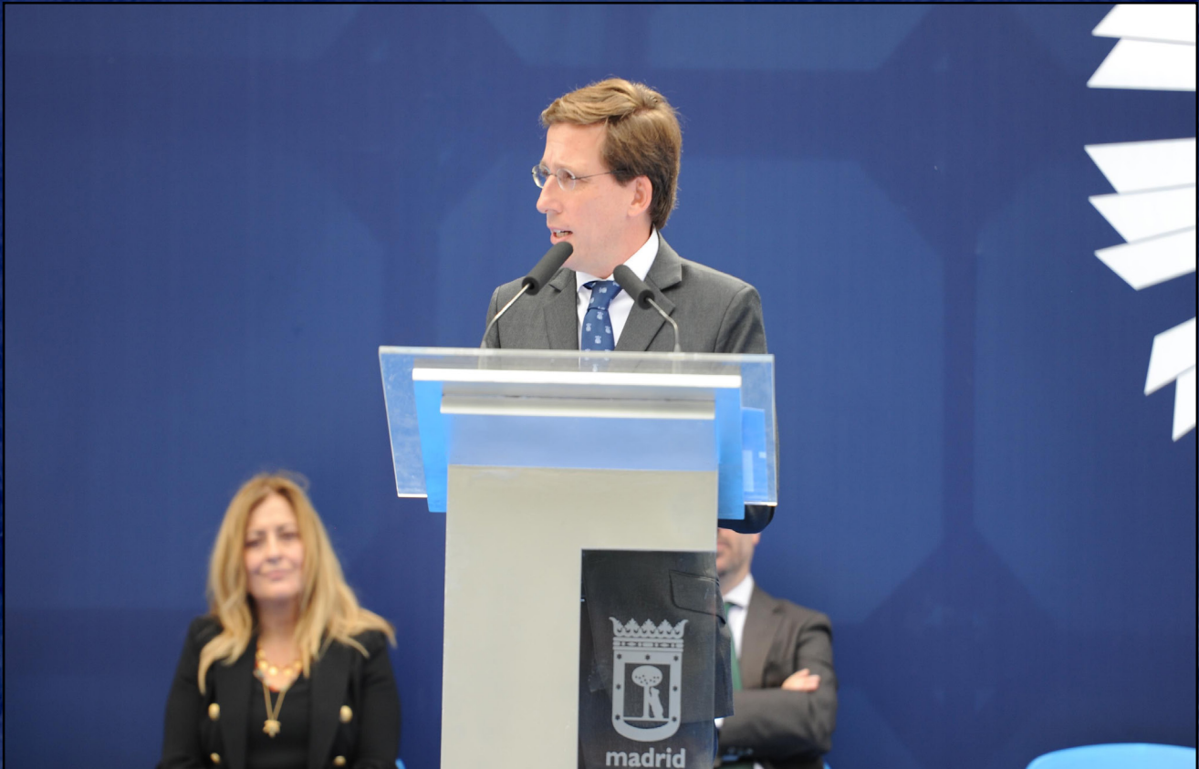
El alcalde de Madrid, José Luis Martínez-Almeida, dirigiéndose a los policías.

Cerró el turno de intervenciones el alcalde de Madrid, que se sumó a las felicitaciones de las personas homenajeadas y manifestó a los agentes el “orgullo de tener la consideración de ser el jefe de la Policía Municipal y ayudar en su trabajo” .