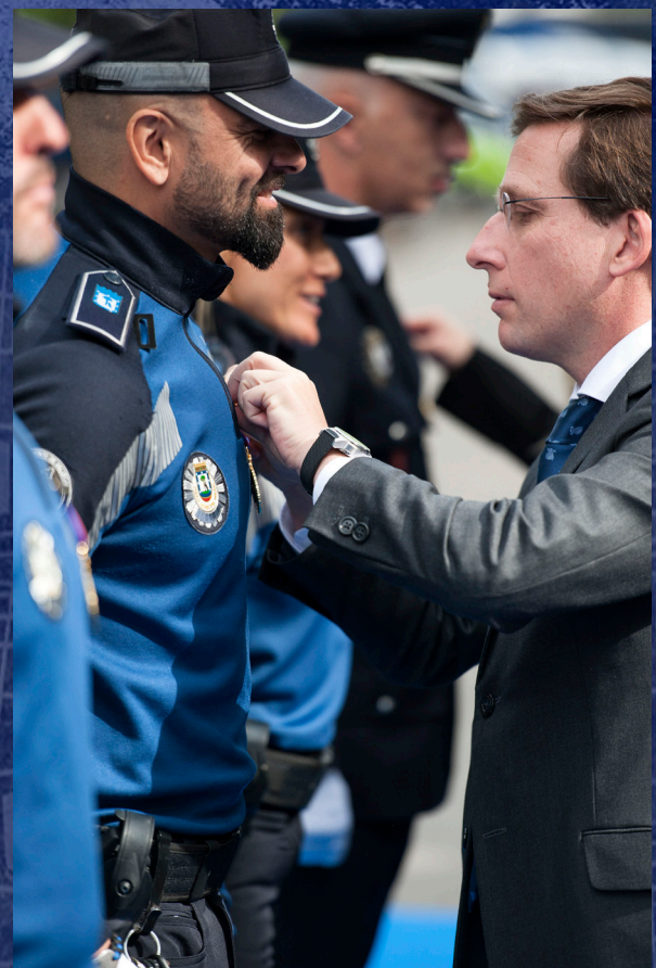
Un agente es condecorado por el alcalde de Madrid, José Luis Martínez-Almeida.