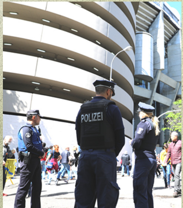
Buena sintonía entre los agentes de ambos cuerpos.

Los policías berlineses finalizan destacando como una característica común de ambos Cuerpos el profundo respeto a la ciudadanía, y la consideración del trabajo policial como garantía de los derechos y las libertades de la ciudadanía.