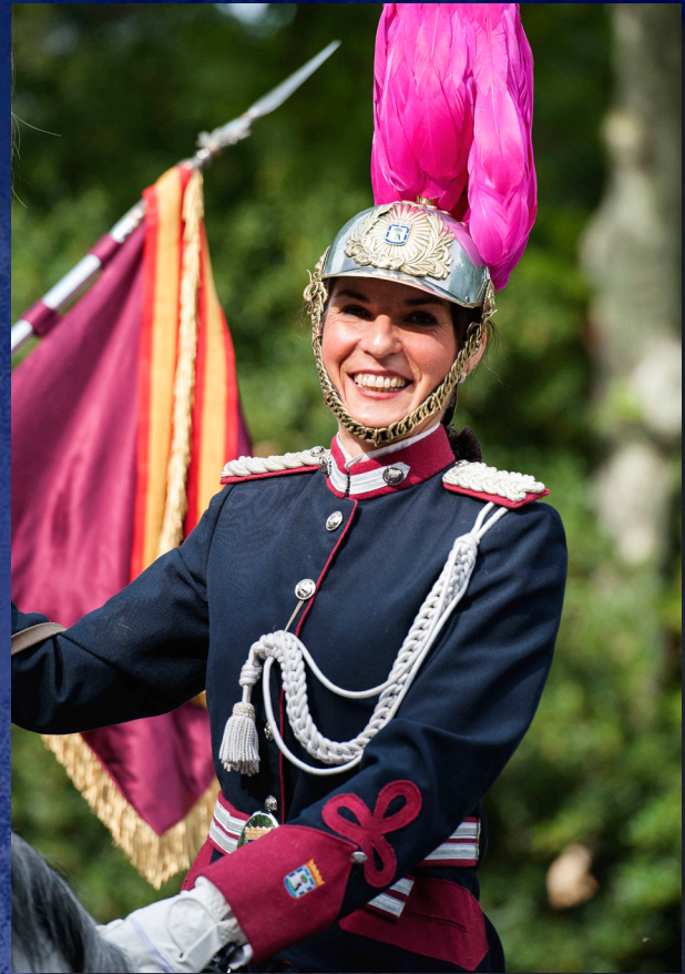
Componente de la Unidad del Escuadrón en el acto de San Juan.

Tras la moderna flota, terminaba el desfile un seat 124, que allá por los años 70 fue el vehículo patrulla de referencia.