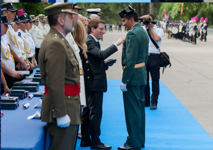
Distinción a mandos del Cuerpo Nacional de Policía y de la Guardia Civil.