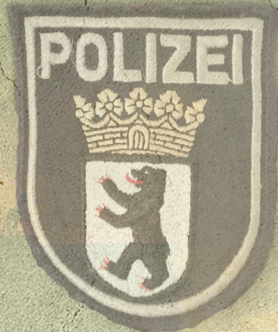
Emblema de la uniformidad de los agentes de la capital alemana

Los agentes alemanes, concluida la programación de servicio, manifestaron su satisfacción por la experiencia, que había cumplido sus expectativas y les había proporcionado conocimientos sobre operativa policial y permitido comparar los dos modelos policiales. "Lo mejor, nos aseguraron, ha sido la excelente relación con los compañeros y jefes de las diferentes unidades de Policía Municipal en las que hemos tenido la oportunidad de trabajar. Han estado siempre pendientes de nosotros. El idioma tampoco ha sido un problema. Nos hemos comunicado en inglés" . En especial agradecen la atención prestada por la Sección Relaciones Internacionales que ha coordinado su estancia en la Policía Municipal de Madrid.