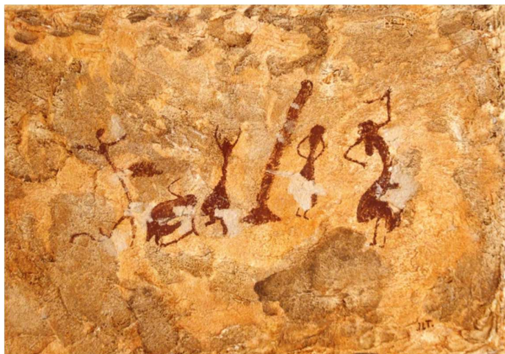
Danza ritual en la Cueva de los Grajos. Cieza (Murcia).

Incluso algunos paneles revelan que las mujeres también participaron en la caza colectiva, realizando tareas de aproximación y acoso animal, camuflaje o sorpresa intimidatoria, como apunta T. Escoriza. También, aprendieron a preparar cerámica para poder almacenar y cocinar alimentos.