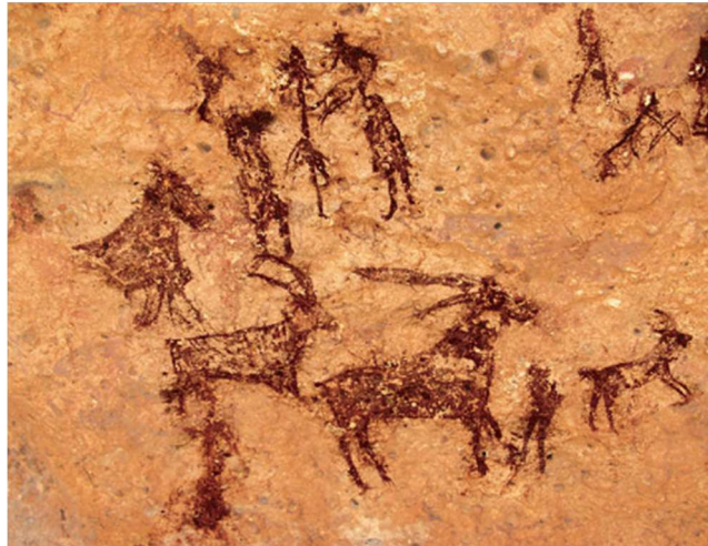
Escena de personas, animales y caza. Abrigo Grande de Menidateda. Hellín (Albacete).

Durante la llamada revolución Neolítica, los grupos humanos consiguieron desarrollar la agricultura y domesticar animales, lo que trajo consigo el asentamiento en lugares estables. La invención de la cerámica provocó el almacenamiento de alimentos pero también el cocinado de los mismos. La mejora de herramientas líticas que facilitasen el procesado y manipulación de los alimentos supuso una mejora en la alimentación y en el desarrollo del grupo. El trabajo de la talla de útiles líticos también pudo ser un rol que, en parte, pudo ser asumida por la mujer para llevar a cabo ciertas tareas.