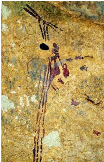
Pintura rupestre: recolección de miel. Cueva de Bicorp (Valencia).

Conocimientos que fueron muy útiles, en relación con su siguiente rol, como cuidadoras y sanadoras de la familia, actividades que articulan la cohesión, las interrelaciones y los vínculos sociales. A todo ello, se une su naturaleza reproductiva, de amamantamiento y parteras, un rol que requiere esfuerzo y dedicación. Por último, los paneles rupestres también reflejan el rol político e ideológico de las mujeres al participar en ceremonias y rituales. Este rol político es más evidente en momentos posteriores a tenor de las evidencias arqueológicas documentadas hasta ahora, por ejemplo la llamada "élite calcolítica" la cual parece estar compuesta por hombres y mujeres, pues en los enterramientos colectivos tan típicos de este momento, los restos humanos tanto de unos como de otros, aparecen en idéntica proporción asociados a elementos de prestigio.