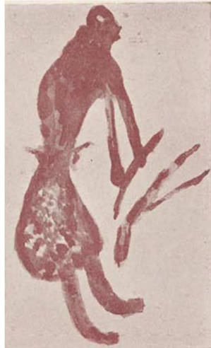
Pintura rupestre del Barranco de las Letras. Abrigo I. Dos Aguas (Valencia).