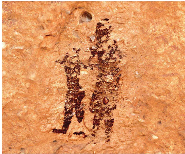
Madre con un niño en Abrigo Grande de Minateda. Hellín (Albacete).