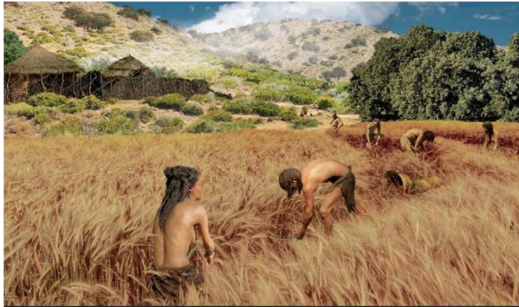
Panel sociedades productoras. Museo de San Isidro. Orígenes de Madrid.

Por tanto, vemos que el éxito de la humanidad ha residido en el trabajo compartido, donde cada individuo aporta su conocimiento y habilidades por el beneficio común. Sin embargo, la historiografía tradicional ha trivializado el trabajo femenino lo que ha dado como resultado la invisibilidad de la mujer en la historia. El problema subyace en la escala de valores que se ha otorgado a la división sexual del trabajo, donde el trabajo femenino se concibe como un trabajo no creativo relacionados con la naturaleza, lo privado, por tanto, considerados trabajos secundarios y auxiliares, en contraposición a las actividades masculinas asociadas a la cultura, al ámbito de los público, consideradas principales y esenciales. Sin embargo, no hay datos arqueológicos que sustenten dicha visión. No hay factores que "demuestre la aparición y desarrollo durante el Neolítico de una idea o una esfera identificable como "femenina", en palabras de Marta Cintas Peña.