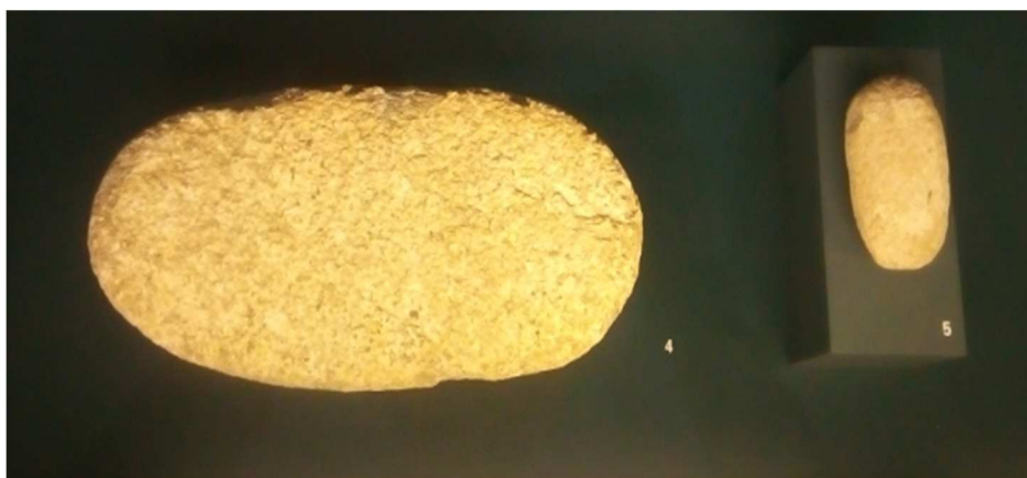
Moledera barquiforme (Perales del Rio, Getafe MSI CE1980/20/01) y moleta (Tejar del Sastre, Usera-Madrid MSI CE1961/218/28). Edad del Bronce.

Domingo: 1 de marzo a las 12:30 horas Entrada libre hasta completar aforo