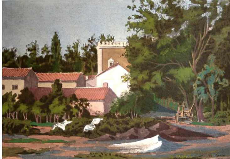
Acuarela de la quinta de Miranda en Carabanchel realizada por Prosper Mérimée en 1840. Álbum del duque de Alba, D. Jacobo Fitz-James Stuart.

cuídese de introducirlos en ácido como se hace a menudo. Así se pueden destruir. Hay que conservar estos objetos con su óxido. Si este óxido es pulverulento se le puede cubrir con aceite, lo que lo tornará algo más sólido. No olvide anotar si se encuentran carbones en la excavación. Esto indica un incendio y por tanto existe la esperanza de encontrar un buen número de objetos cotidianos, pues es posible que en la catástrofe que arruinó el establecimiento antiguo, los propietarios no tuvieran tiempo de llevarse sus muebles. Si descubre restos de piedras o de mármoles esculpidos, hay que conservarlos con cuidado. Le deseo toda suerte de fortuna arqueológica, muchas estatuillas, espejos y sortijas” (Duque de Alba, 1930: 173-174 (carta nº 111).