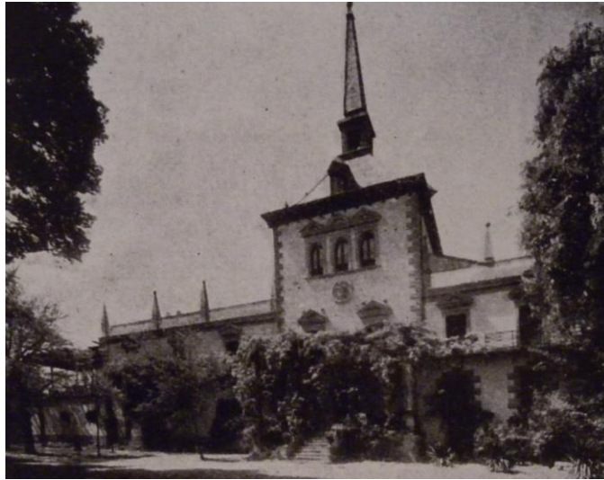
Palacio de la quinta de Miranda, Carabanchel, (c. 1968)