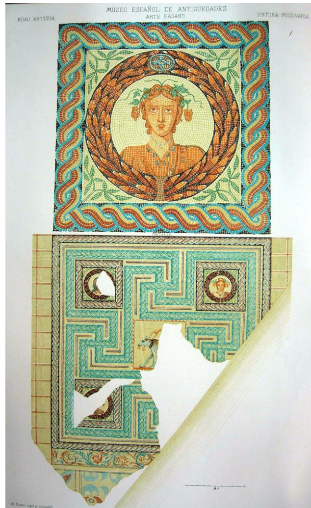
Mosaico de Carabanchel. Cromolitografía de Antonio Bravo (1861)

Juan de Dios de la Rada nos indica que los restos romanos aún no habían sido examinados por los arqueólogos y que la condesa de Montijo habría ordenado la restauración del mosaico: