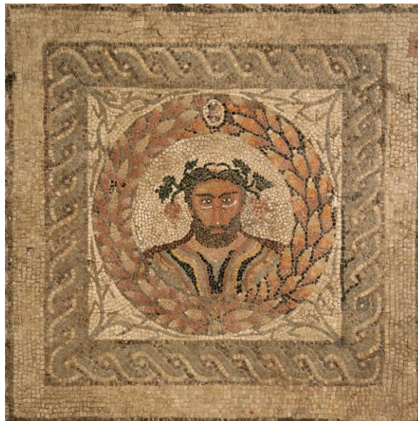
MSI CE1974/124/129. Medallón superior

Domingo: 6 de octubre a las 12:30 horas Entrada libre hasta completar aforo