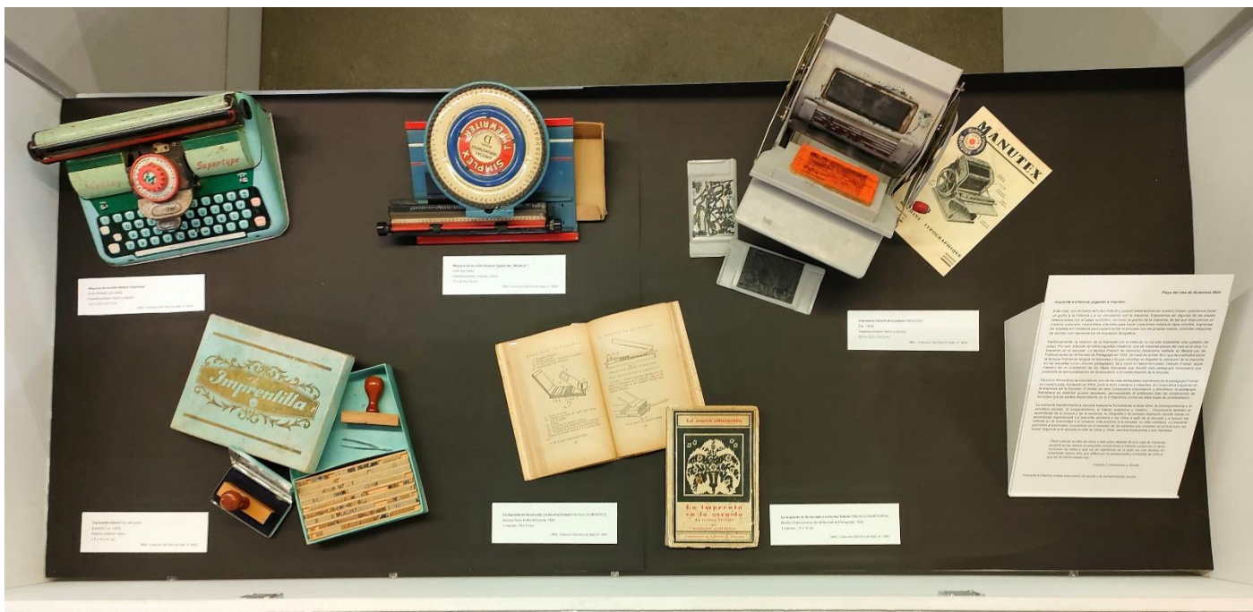
Imprenta e infancia: jugando a imprimir Pieza del mes de diciembre 2024 (vista general)