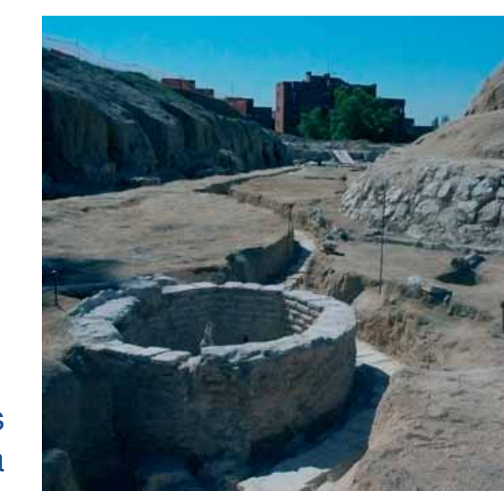
Fuente del ángulo norte