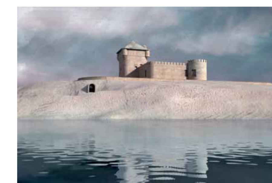
Reconstrucción virtual de la alberca y sus restos en 1953, antes de la construcción del barrio

El jardín se extendía fuera del foso. El resto de la finca estaba ocupado por tierras de labor y por una alberca situada al sur del castillo, ahora bajo las casas del barrio, en la que incluso había una isla y se podía pescar o dar paseos en una embarcación de recreo conocida como el «galeón».