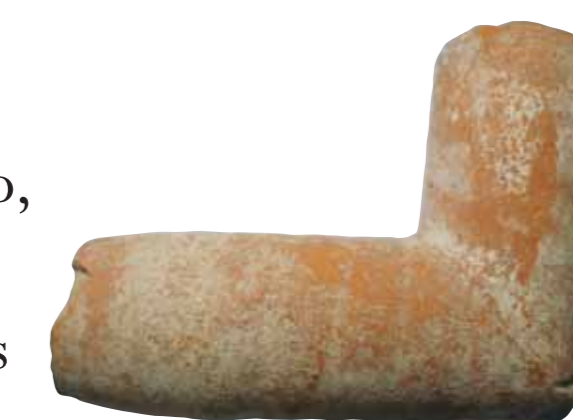
Las tuberías estaban hechas con piezas de cerámica -atanores- diseñadas para encajar unas en otras

No hay un jardín sin agua. En cada una de las esquinas del foso, se alzó una fuente octogonal. Y, para alimentarlas y regar el jardín, se dispuso un sistema de canalizaciones que recorría todo el foso. El agua llegaba hasta él desde una fuente situada al oeste del castillo, junto al actual parque de Juan Carlos I.