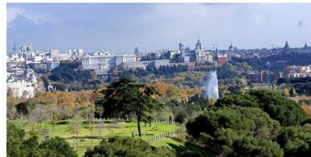
Diagnóstico de Madrid y Plan de Acción

Las intervenciones se centraron en la importancia de la pertenencia a la Red Mundial de Ciudades y Comunidades Amigables con las Personas Mayores y el Plan de Acción que contempla múltiples actuaciones relacionadas con el trato adecuado y la lucha contra el edadismo.