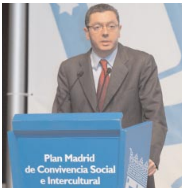
Alberto Ruiz Gallardón, Excmo. Alcalde de Madrid