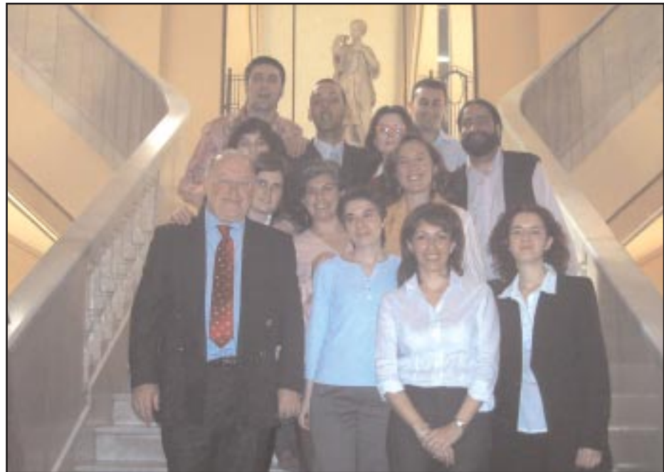
El Equipo del Observatorio

Dirección General de Inmigración, Cooperación al Desarrollo y Voluntariado C/ José Ortega y Gasset 100 - 28006 Madrid Tfnos: 91 480 31 74 / 91 480 31 75 Fax: 91 480 25 31 www.munimadrid.es/observatorio obserconvivencia@munimadrid.es