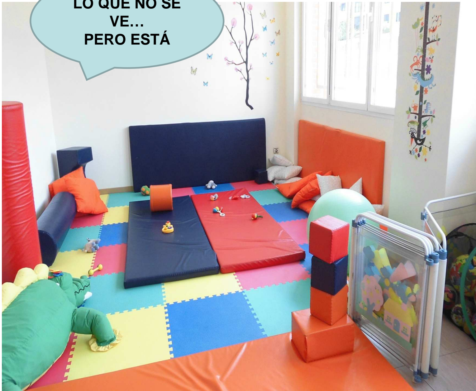
Área de Gobierno de Familia, Servicios Sociales y Participación Ciudadana