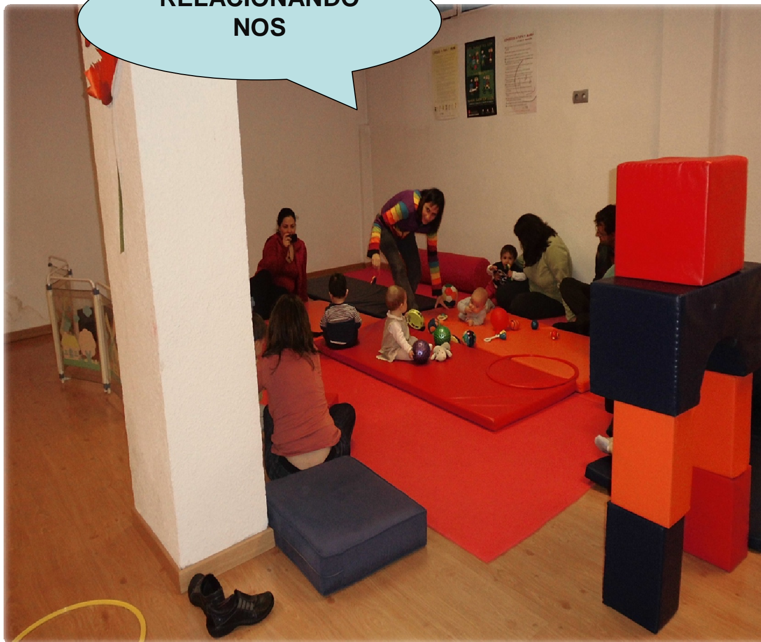
Área de Gobierno de Familia, Servicios Sociales y Participación Ciudadana