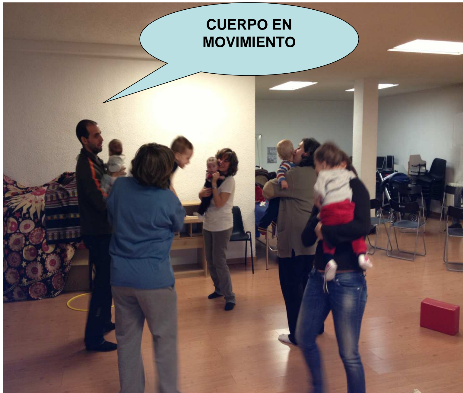
Área de Gobierno de Familia, Servicios Sociales y Participación Ciudadana