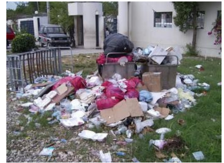
Mala gestión de residuos