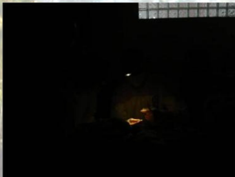
Falta de luz y necesidad de frontales