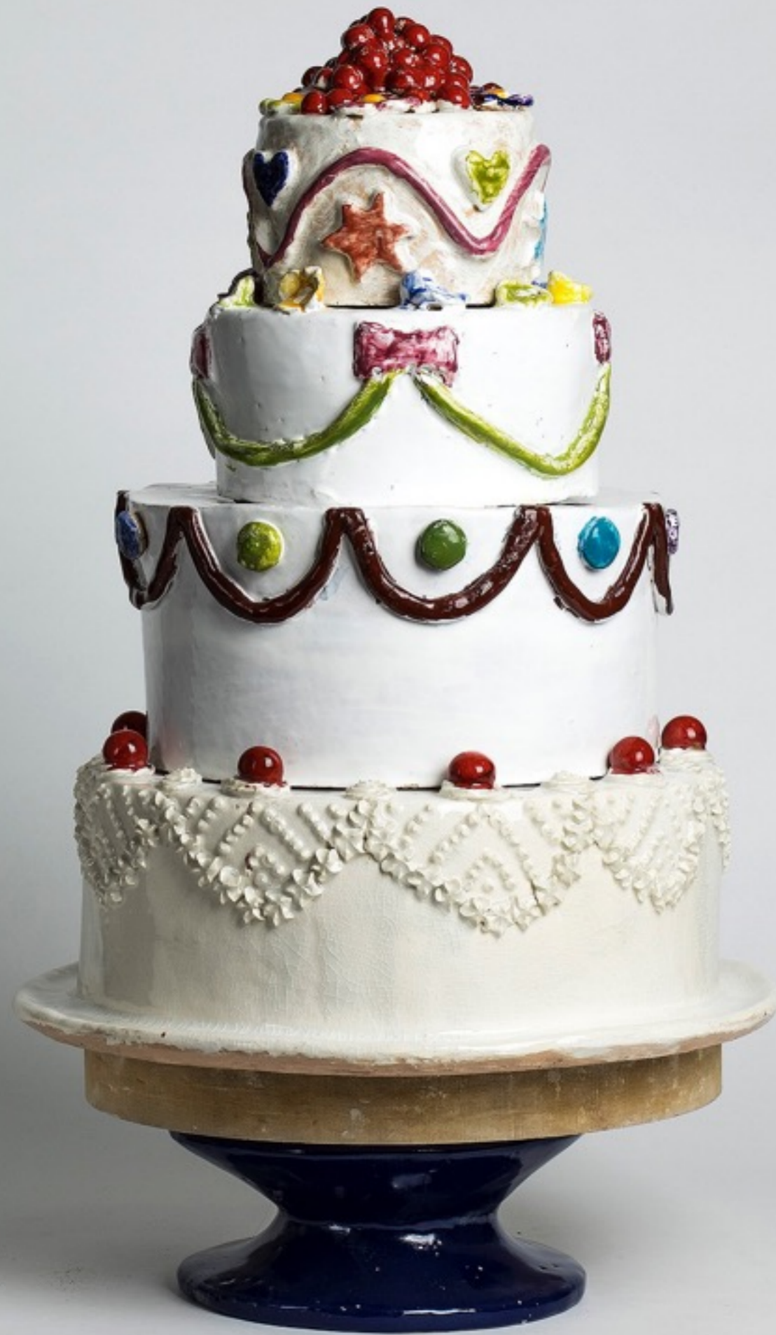
Curso Primero - Técnicas de Decoración