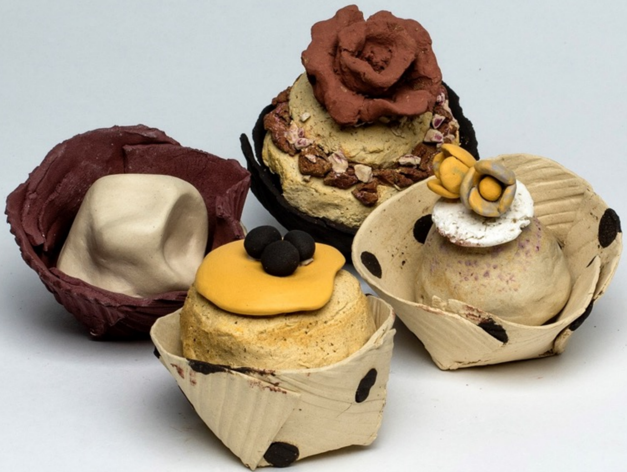
Taller de Arte y Naturaleza