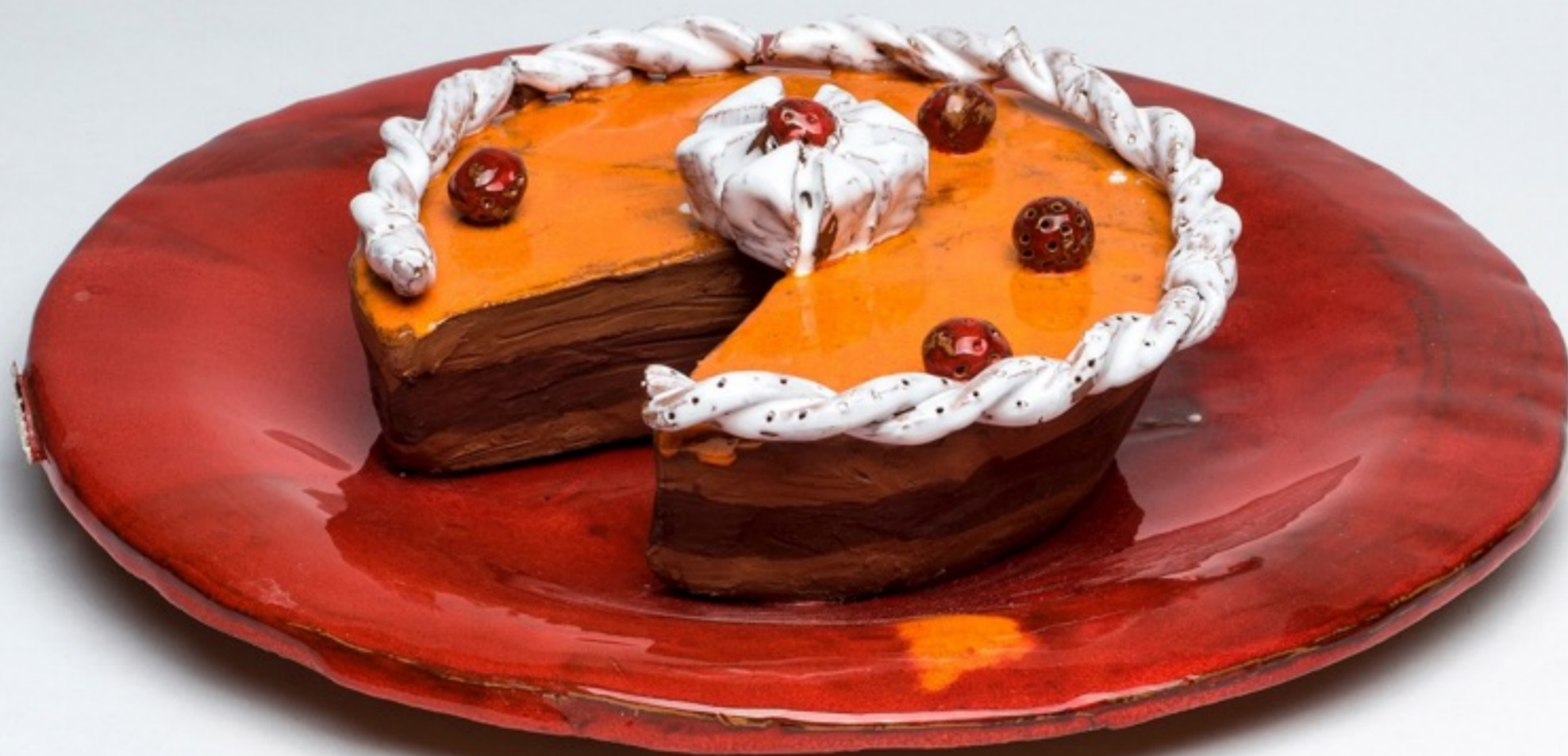
Charo del Prado