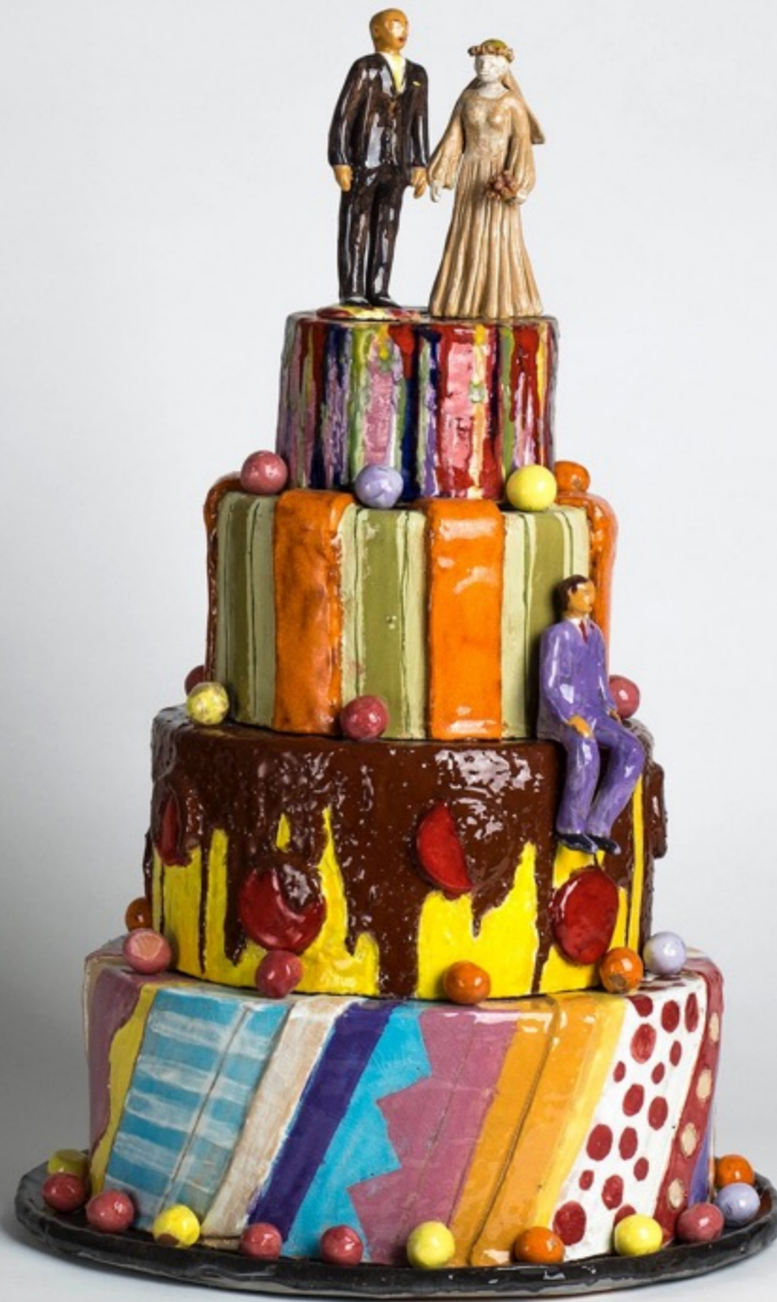
Curso Primero - Técnicas de Decoración