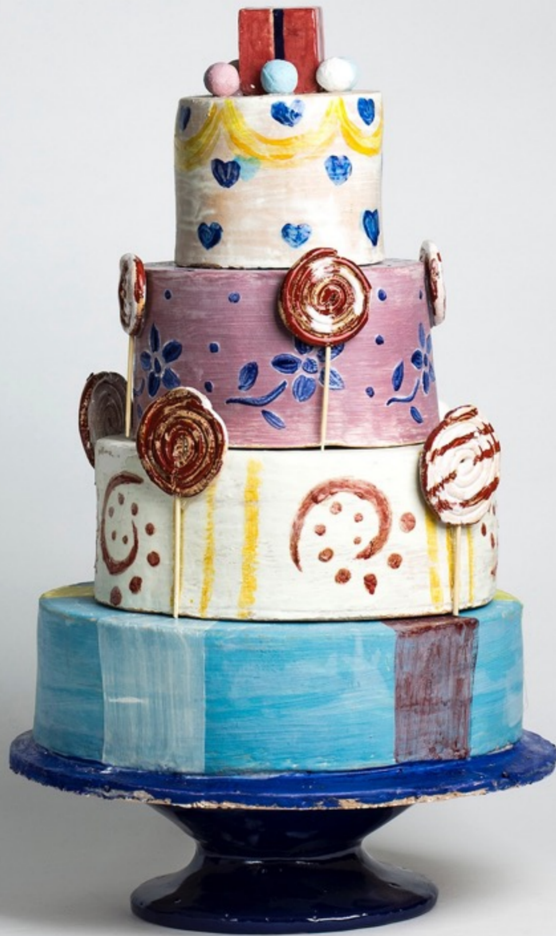
Curso Primero - Técnicas de Decoración