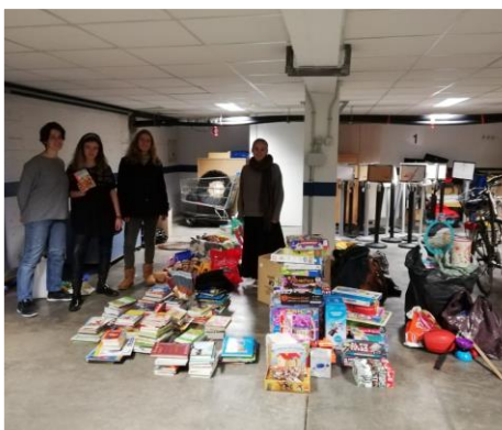
Calendrier de l'avent solidaire