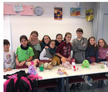
Troc de Noël