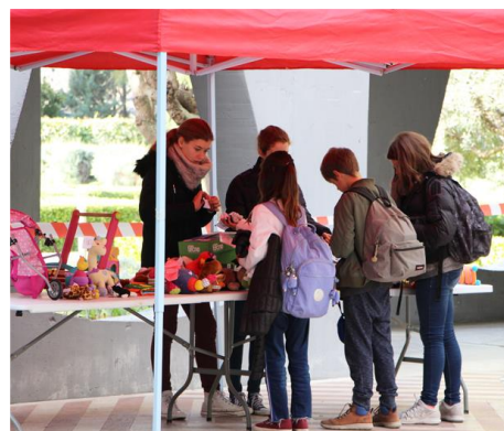
Troc de Noël