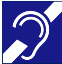
Símbolo de la discapacidad auditiva