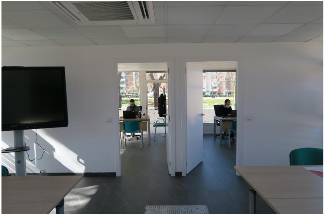
Interior de la Oficina de Vida Independiente