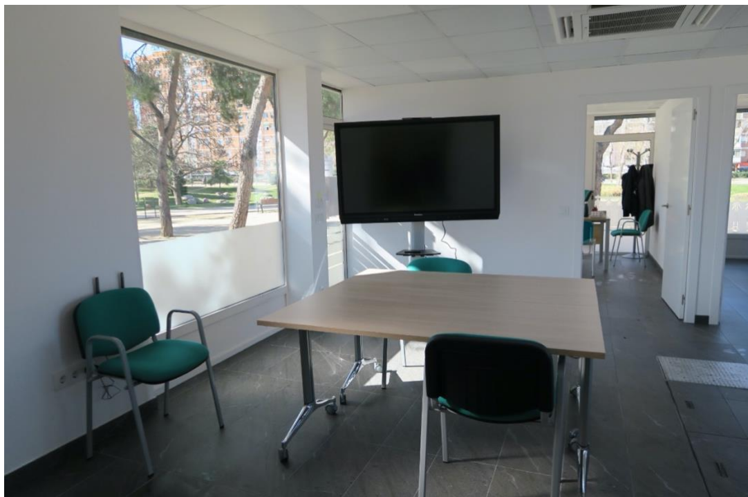
Interior de la Oficina de Vida Independiente