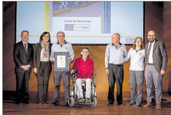
Acto de entrega de reconocimientos. EE

Las cartas de servicios son documentos públicos mediante los cuales los ayuntamientos y otras organizaciones informan a los usuarios de los servicios que prestan y de los compromisos que asumen en la prestación de los mismos con transparencia. En el desarrollo de las cartas de servicios se tienen en cuen-