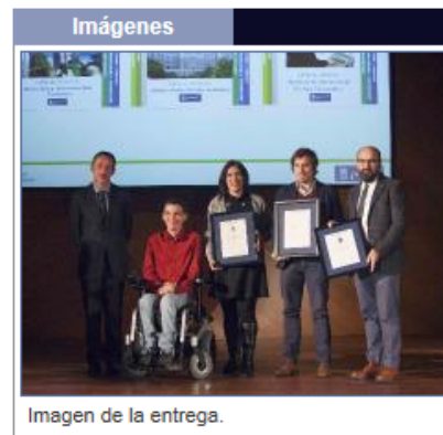
Imagen de la entrega.

Las Cartas de Servicios del Ayuntamiento de Madrid permiten que la ciudadanía conozca, explicados de forma sencilla y cercana, los servicios prestados y los órganos implicados, sus derechos y responsabilidades como usuarios de estos servicios y los mecanismos de participación que tienen a su disposición, con especial referencia al sistema de sugerencias, reclamaciones y felicitaciones.