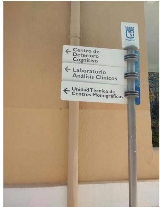
Entrada principal edificio Montesa 22 y señalización del edificio B

La inspectora accede a la página web del servicio, en la que se informa de manera breve sobre los servicios que presta el Centro, así como horarios de atención presencial y dirección del Centro.