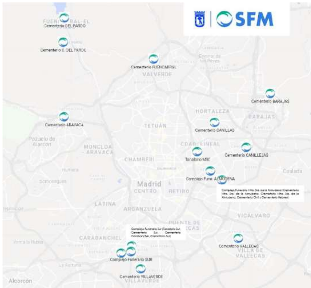
Ubicaciones de Tanatorios, Crematorios y Cementerios Municipales - www.sfmadrid.es