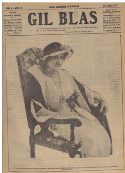
Fig. 5: La soprano rusa María Kousnezoff en la portada del núm. 5 de Gil Blas en su visita a España. Gil Blas (5), 18 de junio de 1915.

de artistas que intervinieron con dibujos inéditos o también las que fueron representadas mediante textos e ilustraciones como las de Salvador Bartolozzi (Fig. 4), al tiempo que estaban presentes también gracias a las entrevistas de Carmen de Burgos. Incluso, acapararon algunas portadas, como la del núm. 5 del 15 de junio, en la que aparece una fotografía de la soprano rusa María Kousnezoff y que nos proporciona información sobre la visita de la cantante a España (Fig. 5).