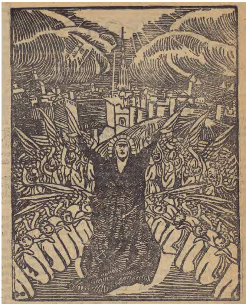
Fig. 6: Reproducción del aguafuerte La visión de Santa Teresa de Jesús de Angelina Beloff para el artículo que Gómez de la Serna le dedica en Gil Blas (22 de junio de 1915: 9).