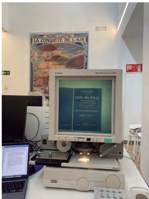
Fig. 3: Fotografía de la Hemeroteca Municipal de Madrid con Almanaque del Ángel del Hogar en uno de sus lectores de microfilmes.

Hemeroteca Municipal de Madrid y en las sedes de la Biblioteca Nacional en Recoletos y Alcalá de Henares (Madrid), disponibles en microfilme o facsímiles impresos, al igual que el propio Almanaque (Fig. 3).