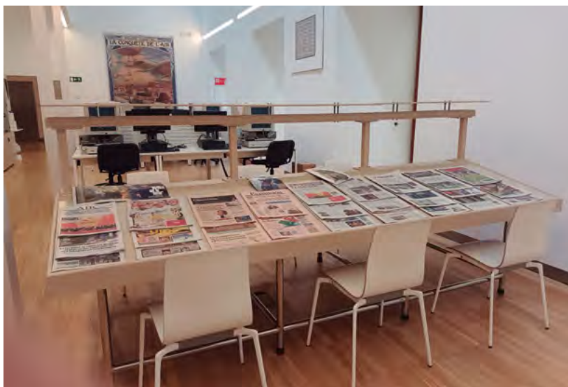
Fig. 3. Fotografía de la sala de consulta de la Hemeroteca Municipal de Madrid con algunos títulos contemporáneos sobre la mesa.