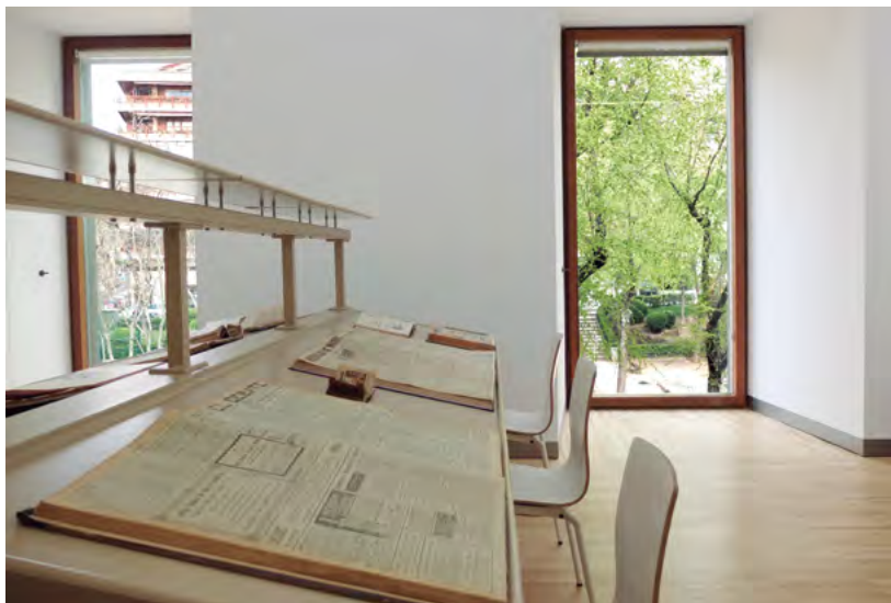
Fig. 2. Vista de la sala de consulta de la Hemeroteca Municipal de Madrid con algunos de los títulos que forman parte de su fondo.