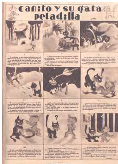
Figs. 6 y 7. Izquierda: Ilustración de Dehly Tejero para Crónica , 31 de diciembre de 1933: 32, y tira de «Canito y Peladilla» de Pitti Bartolozzi en Crónica , 16 de diciembre de 1934: 34.

éxito infantil. Su gran trabajo para esta revista fue la tira infantil «Canito y su gata Peladilla» (Fig. 7), aunque también ilustró cuentos de otras autoras. Igualmente, a esto se dedicó la ilustradora infantil y de humor Alma Tapia, que ilustró cuentos, entre otros de la escritora Elena Fortún 32 , afamada autora de las historias de «Celia».