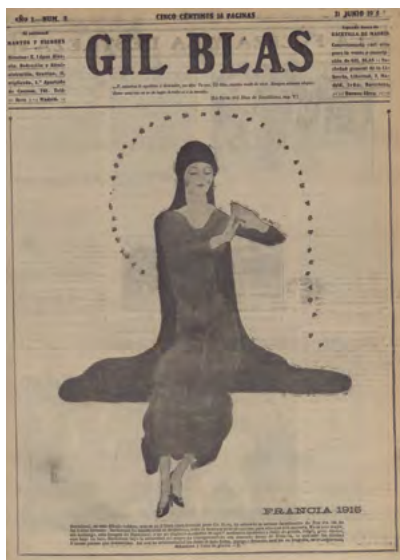
Fig. 4: Ilustración de Bartolozzi para la portada del núm. 3 de Gil Blas , donde personaliza «la belleza inestimable de Francia» mediante la figura femenina. Gil Blas (3), 11 de junio de 1915. Hemeroteca Municipal de Madrid.