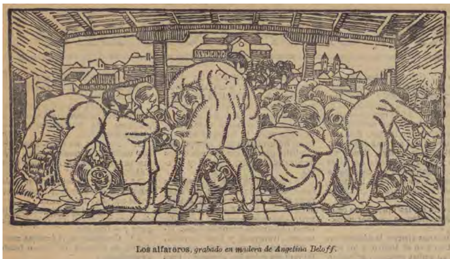
Los alfareros, grabado en madera de Angelina Beloff.