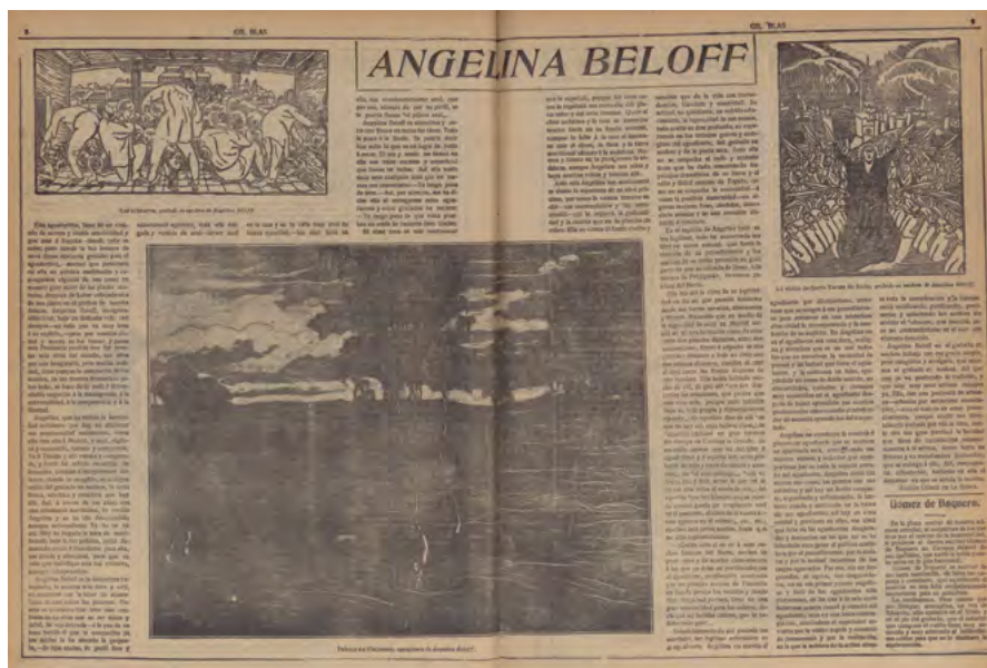
Fig. 8: Reproducción del aguafuerte Los alfareros de Angelina Beloff. Gil Blas , 22 de junio de 1915. Hemeroteca Municipal de Madrid.