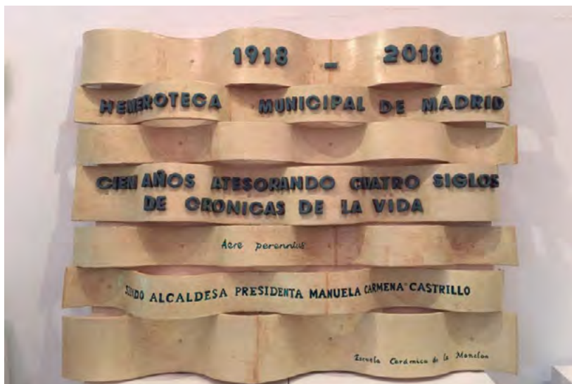
Fig. 1. Fotografía de la placa del centenario de la Hemeroteca Municipal de Madrid realizada por la Escuela de Cerámica de la Moncloa.

en 1918 conserva prensa proveniente de todo el mundo, desde el siglo XVII hasta mediados del siglo XX. A partir de 1966 se recoge, casi exclusivamente, publicaciones periódicas editadas dentro del área municipal madrileña. Un fondo excepcional por su cantidad y calidad de más de cuatro siglos de diarios, revistas y otros impresos procedentes de todo el mundo.