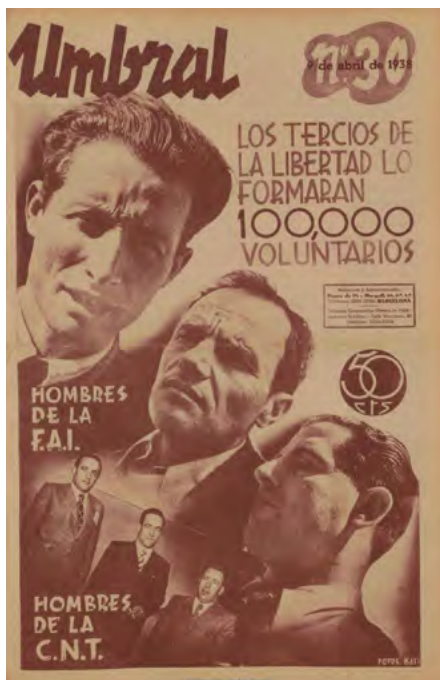
Fig. 8. Portada firmada por Kati Horna para Umbral , 9 de abril de 1938: 1. Biblioteca Nacional de España.