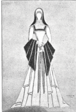
Derribada el pañolón...

En el real, hácese cábalas, échanse trazos e la Reyna Isabel con el Rey juntamente de presente, sostienen los dares y tomares e la Reyna da valor a los valientes ca siempre hácelos ventaja e vienen todos, en que los pechos resistan henden armas non sean