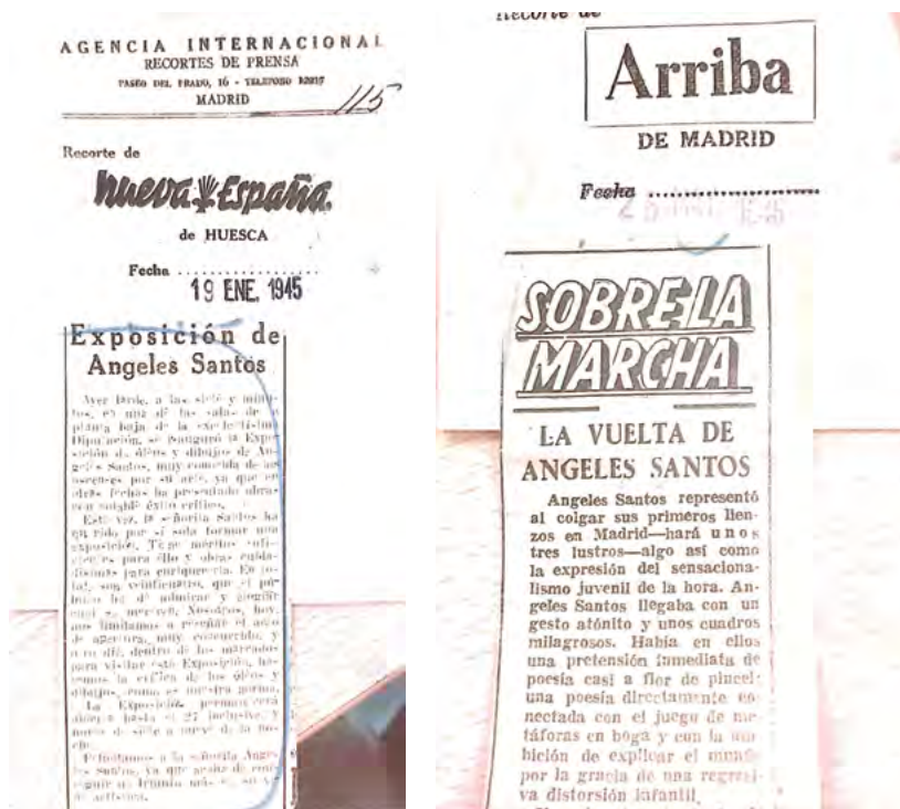
Fig. 3. Izquierda: «Exposición de Ángeles Santos», Nueva España , Huesca, 19 de enero de 1945. Fotografía de Santos Yubero. Fichero de Arte Español Moderno. Archivo CCHS (CSIC). Derecha: José Aguilar. «La vuelta de Ángeles Santos», Arriba , Madrid, 25 de mayo de 1946. Fichero de Arte Español Moderno. Archivo CCHS (CSIC).

podemos conocer distintas actividades o acontecimientos que cambian por completo nuestra percepción de las artistas, de lo que sabemos sobre ellas.