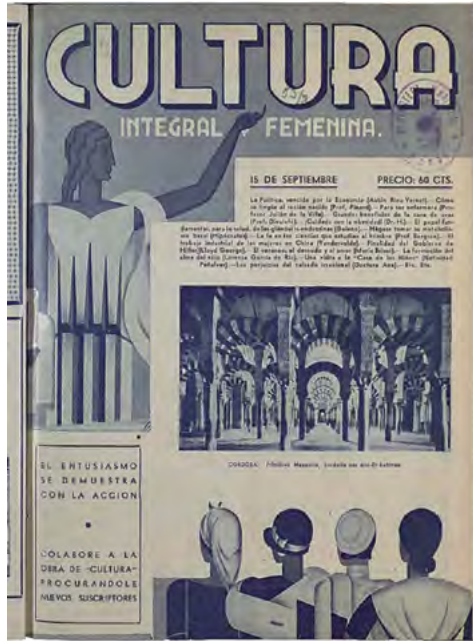
Fig. 5. Portada de Cultura integral y femenina , 15 de diciembre de 1933: 1.

tura Integral y Femenina 27 (Madrid, 1933-1934) (Fig. 5) o Mujeres Libres 28 (Barcelona, 1936-1938) son herramientas fundamentales para acercarse a organizaciones como la Asociación Nacional de Mujeres Españolas, conocer algunas de las actividades culturales del Lyceum Club de Madrid o entender mejor la relación de las mujeres con el movimiento anarquista español, respectivamente.