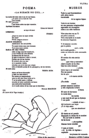
Figs. 2 y 3. Izquierda: Portada de la revista Ultra con grabado de Norah Borges. Ultra , 10 de febrero de 1922: 1. Derecha: Ilustración de Eva Aggerholm para un poema de Nicolás Beauduin, Ultra , 20 de mayo de 1921: 5. Biblioteca Nacional de España.

los nombres más sonados del país. Manuel Abril, Enrique Lafuente Ferrari o Eugenio d’Ors, entre otros, compartieron sus juicios artísticos en la publicación. Al respecto de Norah Borges, escribió Benjamín Jarnés —ensayista y escritor— en La Gaceta Literaria :