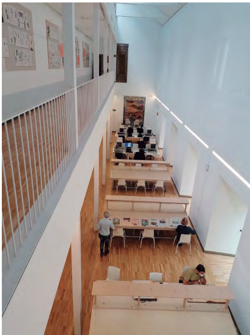
Fig. 4. Fotografía de la Sala de Investigación de la Hemeroteca Municipal de Madrid con puestos para la consulta del fondo impreso y dispositivos para la consulta de material digitalizado y microfilmado.