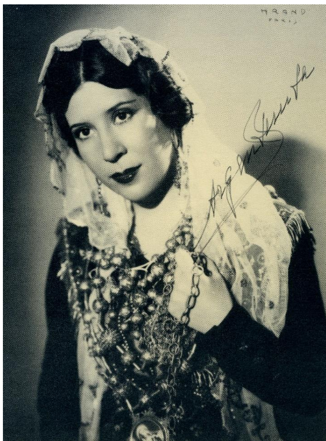
Encarnación López Júlvez, La Argentinita ; vestida para interpretar Los mozos de Monleón .

Encarnación López Júlvez, nacida en Buenos Aires y conocida como La Argentinita , fue bailarina, coreógrafa, bailaora de danza española y flamenco, y cantante.