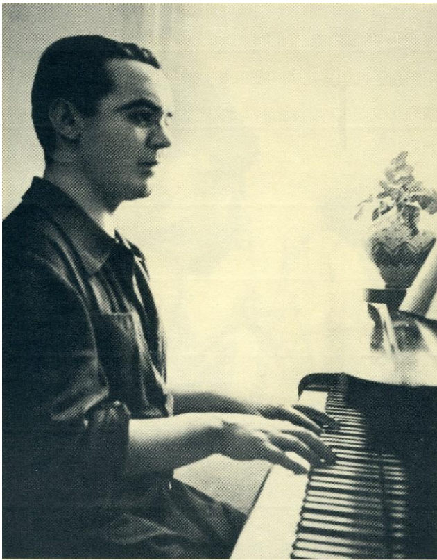
Federico García Lorca tocando el piano. Verano de 1935

Una de sus investigaciones le llevó a trabajar junto al filólogo, historiador y musicólogo Ramón Menéndez Pidal. El trabajo del coruñés acerca del romancero, la lírica y la música tradicional española, se inscribió en un movimiento de interés por este tema en las dos primeras décadas del siglo XX. Lorca acompañó a Menéndez Pidal en la recogida de romances tradicionales en el barrio del Albaicín y en las cuevas del Sacromonte.