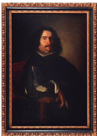
Retrato de Agustín Moreto, atribuido a Juan de Pareja, h. 1648-1653. Óleo sobre lienzo. Museo Lázaro Galdiano.

El Cuarto Centenario del nacimiento en Madrid de Agustín Moreto (1618-1669) celebra a uno de los dramaturgos principales del Barroco, si se amplía la conocida tríada de Lope de Vega, Tirso de Molina y Calderón de la Barca. Entre su producción, que ronda las 60 comedias y 35 piezas breves, destacan títulos como El lindo don Diego , El desdén, con el desdén , No puede ser , De fuera vendrá y El poder de la amistad , del que se conserva el autógrafo. Además de su obra en solitario, dos de sus técnicas de escritura le hacen representante de una nueva manera de hacer comedias: la colaboración con otros dramaturgos y la reescritura de nuevas obras a partir de antiguas. Otros autores se sumaron a esta escritura mancomunada: desde Calderón a Guillén de Castro, Mira de Amescua, Rojas Zorrilla, Vélez de Guevara y Ruiz de Alarcón. Junto a ellos, Martínez de Meneses, Matos Fragoso, Cáncer, Coello, Belmonte Bermúdez, Solís, Diamante, Villaviciosa, Godínez, Cubillo de Aragón y Monteser. Una constelación de dramaturgos que trabajaron unidos para divertirse y satisfacer a un público exigente que reclamaba el teatro como principal modo de evasión. Moreto es el autor dramático español más característico del tercer cuarto del siglo XVII.