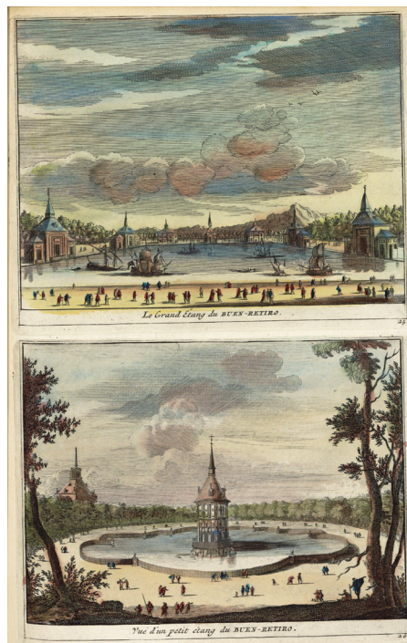
Buen Retiro. En: Juan Álvarez de Colmenar. Annales d'Espagne et de Portugal Amsterdam, 1741. Biblioteca Histórica Municipal, I 257.

La fiesta teatral en el palacio del Buen Retiro y en los sitios de recreación del rey fue uno de los grandes momentos de proyección de imagen pública de la Casa de los Austria en el siglo XVII. Concebida como un espectáculo total, participaron en su preparación pintores, escenógrafos, arquitectos y otros oficios, bajo la supervisión de personajes de la corte. A la comedia le acompañaron otras obras dramáticas más breves, a menudo como contrapunto cómico. Las fábulas mitológicas dramatizadas se sumaron a los argumentos caballerescos e históricos en las grandes fiestas. Estuvieron destinadas a la pedagogía de reyes y aún más a la exhibición de la imagen y los valores del buen gobernante.