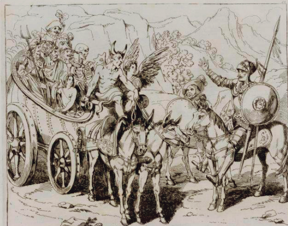
Carro de comediantes. Roma, 1835. Aguafuerte. Biblioteca Histórica Municipal, Cer 1586.