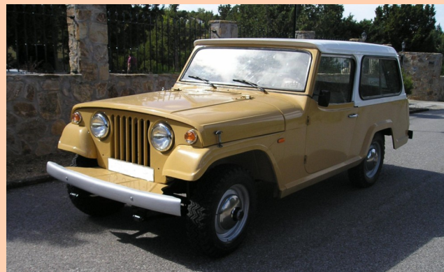
Jeep VIASA Comando HD. 1980.