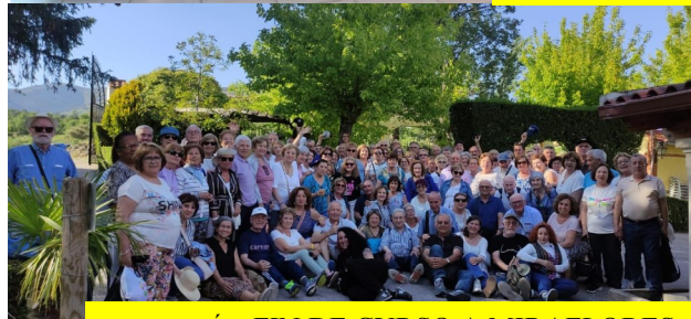
EXCURSIÓN FIN DE CURSO A MIRAFLORES

El equipo de redacción de la revista, desea a todos los socios un feliz verano.