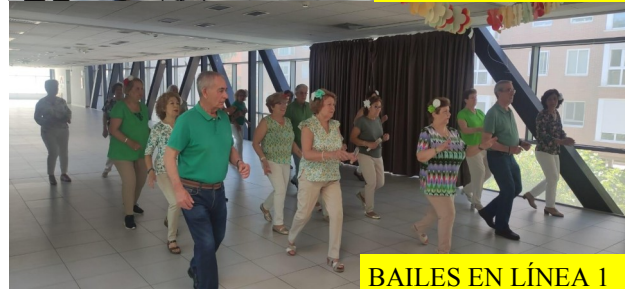
BAILES EN LÍNEA 1