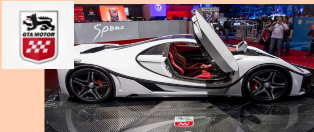
GTA Spano 8.0

Tabla elaboración del autor diciembre 2017