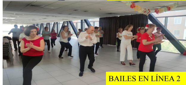
BAILES EN LÍNEA 2