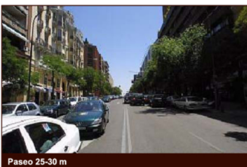
Paseo 25-30 m

Avenidas de 25-30 m de ancho que aparecen de manera sistemática en los ensanches, bien en los bordes de contacto con la antigua ciudad, como malla de grado superior a la retícula viaria o como preexistencia de un camino histórico. Ocupados por un bulevar central ajardinado en origen, han sido sustituidos por viario rodado en casi todos los casos. Más recientemente se han recuperado medianas de dimensiones mínimas que permite arbolado de alineación en el centro de la calle.