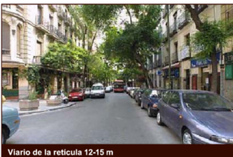
Viaro de la retícula 12-15 m

Todo el tejido se compone de calles de 12-15 m de ancho. Trazado siempre rectilíneo en retícula con manzanas de 60-100 m. Aparecen pequeñas zonas estanciales en los cruces.