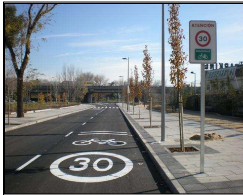
Señalización C/ Cifuentes como Ciclocalle

Una de las primeras ciclocalles que se han puesto en marcha es la C/ Cifuentes, vía que permitirá ir en bicicleta desde la Avenida de Andalucía a la futura Catedral de las Nuevas Tecnologías de la Nave Boetticher.