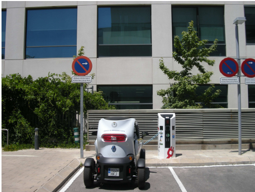
Reserva Vehículos Eléctricos