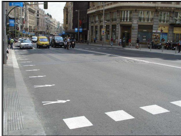
Paso de Peatones en la Red de San Luis

Es el paso de peatones más ancho de toda la ciudad de Madrid que cuenta con 20 metros y registra la circulación diaria de 24.000 peatones.