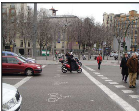
Avanza Motos Ciudad Barcelona