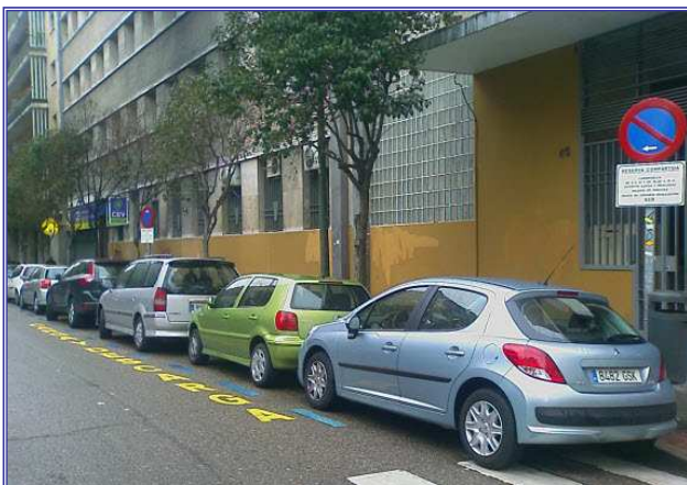
Reserva Compartida Pza. Tirso de Molina

Hay un total de 47 reservas en Madrid, de las que 26 están en el distrito de Centro (Pza. Tirso de Molina, C/ Colegiata, C/ Ribera de Curtidores, C/ Concepción Jerónima y Pza del Cascorro), y las otras 21 reservas se encuentran en el distrito de Chamberí (C/ Fernando el Católico, C/ Andrés Mellado, C/ Gaztambide, C/ Guzmán El Bueno, C/ Fernández de los Ríos, C/ Donoso Cortés y C/ Joaquín María López).