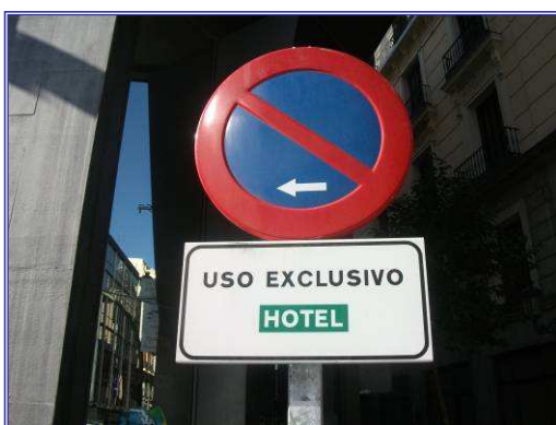
Señalización Vertical Reserva Hotel

Actualmente en la ciudad de Madrid existe un total de 95 reservas para hoteles, de las cuales 31 se han instalado a lo largo del año 2011. Estas reservas pueden ser de uso exclusivo para los hoteles o de uso dotacional. En el año 2011, se ha unificado el texto del cajetín de las 68 reservas de uso exclusivo: "Uso Exclusivo Hotel". Por otro lado, hay 27 reservas de estacionamiento para Hoteles de uso dotacional con el texto "De 8 a 22h . Excepto Carga y Descarga y Subida y Bajada de Viajeros. Tiempo Máximo 30 minutos".