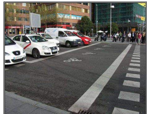
Avanza Motos Pza. Castilla