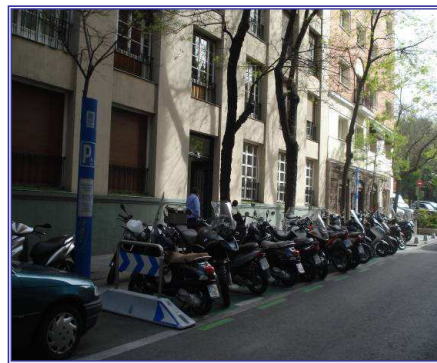
Reserva en C/ López de Hoyos 15