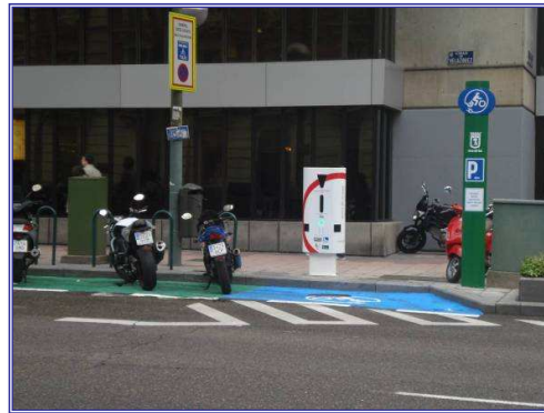
Reserva Motos Eléctricas