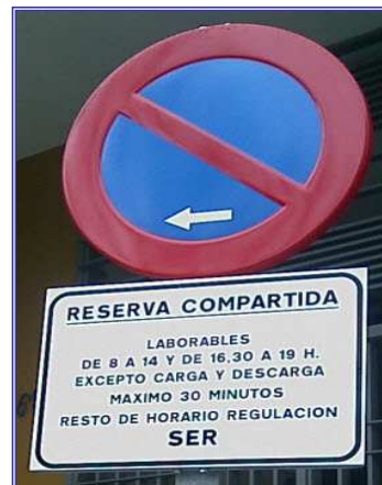
Señalización Vertical Reserva Compartida