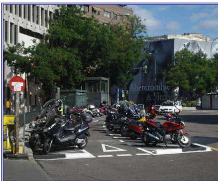
Reserva en Pza. Marqués de Salamanca

Ante el espectacular aumento del número de motocicletas y ciclomotores, ha crecido la demanda de espacio para el estacionamiento de estos vehículos, principalmente en las zonas más céntricas de la ciudad. En este año se han instalado un total de 103 reservas.