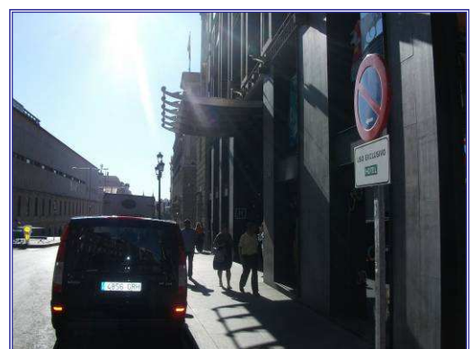
Reserva Hotel Carrera de San Jerónimo 34