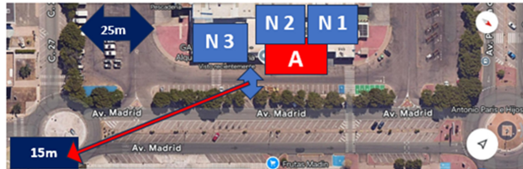
ANCHO VIAL FACHADA "A"