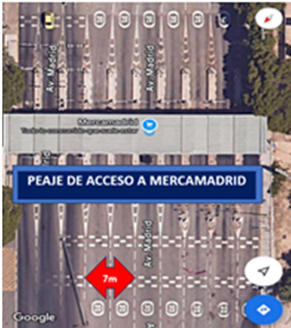
ANCHO DE VIALES DE ACCESO A MERCAMADRID