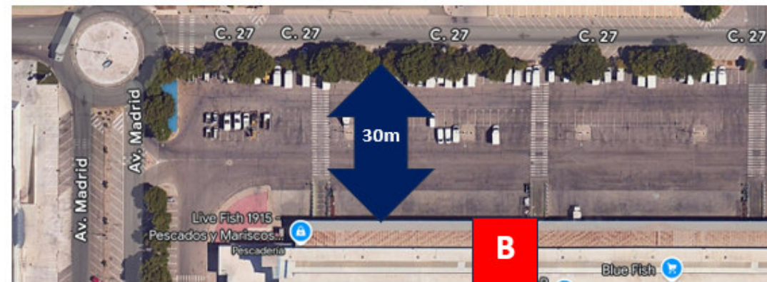
ANCHO VIAL FACHADA "B"