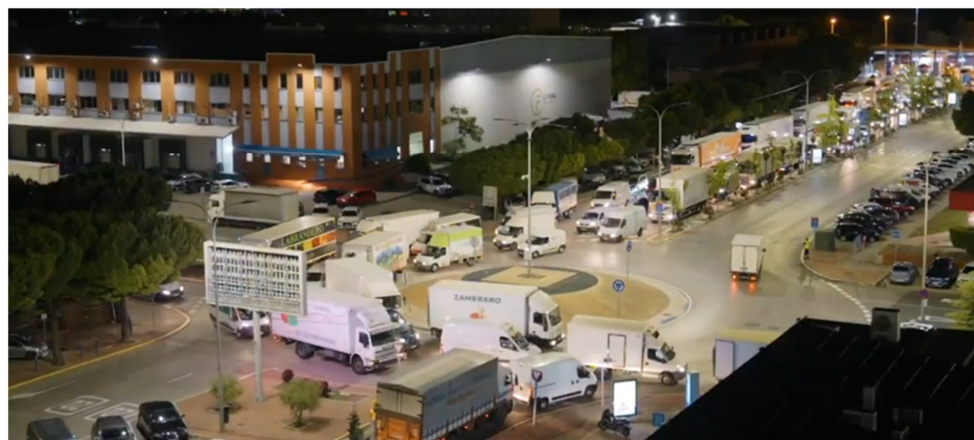
Imag. 2: Los accesos al interior de Mercamadrid se encuentran colapsados.