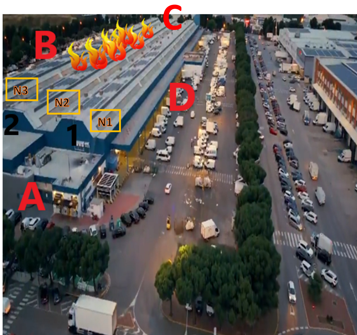
Imag. 1: Localización del Incendio.

BO-81, EA-81, SR-08, JG-02, BA-21, TANG-21 y BO-131.