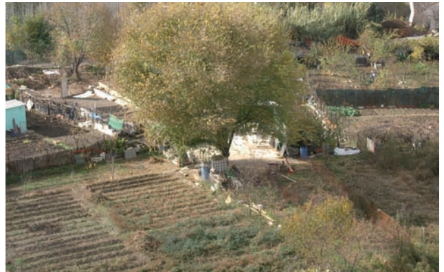
Demolición de construcción en zona verde en camino del Malecón. Distrito de Villa de Vallecas.