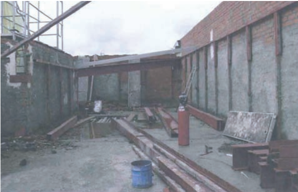
Recuperación de la volumetría de la cubierta en edificio catalogado en c/ Hortaleza. Distrito de Centro.