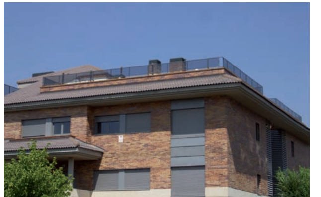
Demolición de cubrición de ático en c/ Cabellera de Berenice. Distrito de Moncloa-Aravaca.