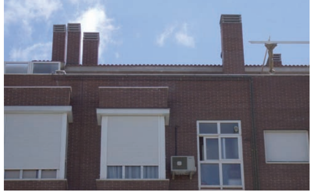
Demolición de ampliación en ático en c/ Monasterio de Silos. Distrito de Fuencarral-El Pardo.