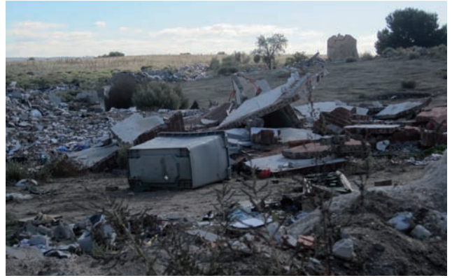
Demolición de construcción en suelo no urbanizable en camino de la Leña. Distrito de Villa de Vallecas.